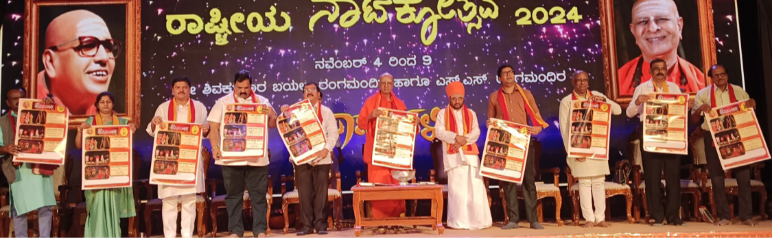
ನಾಟಕೋತ್ಸವದಲ್ಲಿ ಶಿವಸಂಚಾರದ ಪೋಸ್ಟರ್‌ಗಳನ್ನು ಗಣ್ಯರು ಬಿಡುಗಡೆ ಮಾಡಿದರು.