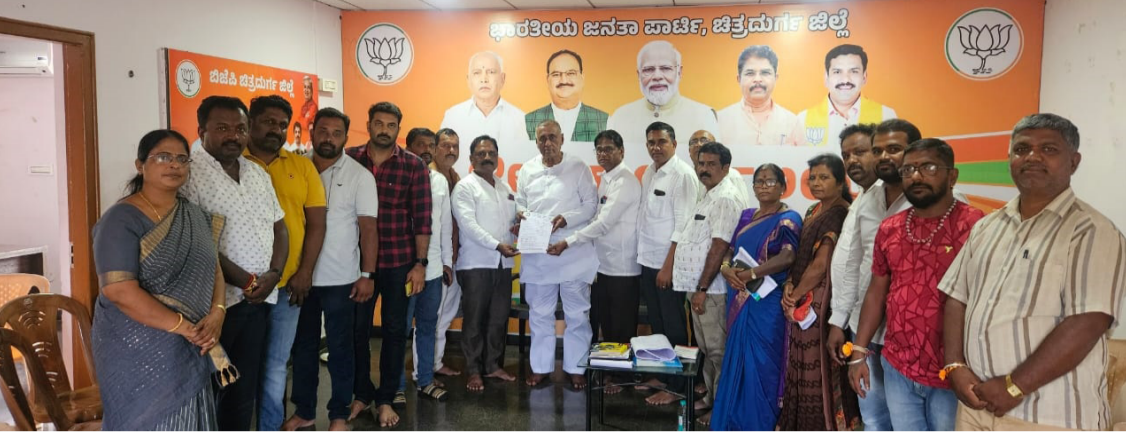
ಯಾವ ಕಾರ್ಯಕರ್ತ ತನ್ನ ಬೂತ್ ನಲ್ಲಿ 50 ಜನರನ್ನು ಪಕ್ಷದ ಸದಸ್ಯರನ್ನಾಗಿ ಮಾಡುತ್ತಾರೋ ಅಂತಹವರು ಪಕ್ಷದಲ್ಲಿ ಸಕ್ರಿಯ ಕಾರ್ಯಕರ್ತರಾಗುತ್ತಾರೆ ಇವರು ಮುಂದಿನ ದಿನದಲ್ಲಿ ಪಕ್ಷದ ವಿವಿಧ ರೀತಿಯ ಹುದ್ದೆಗಳನ್ನು ಅಲಂಕರಿಸಲು ಇದು ಸಹಾಯವಾಗುತ್ತದೆ ಎಂದರು. ದೇಶದಲ್ಲಿ ಅತಿ ಹೆಚ್ಚು ಸದಸ್ಯರನ್ನು ಹೊಂದಿರುವ ಪಕ್ಷ ನಮ್ಮದಾಗಬೇಕೆಂದು