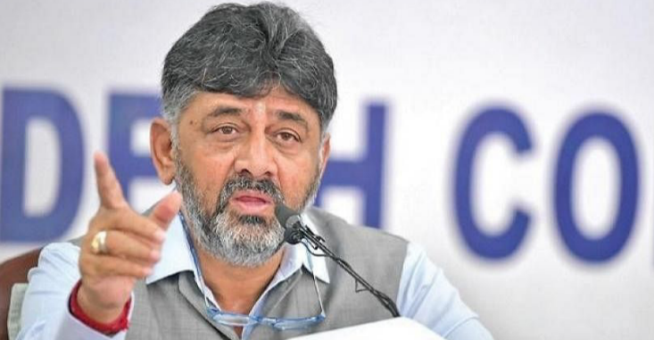
ಲೋಕಸಭೆ ಚುನಾವಣೆಯಲ್ಲಿ ಒಂದಷ್ಟು ವ್ಯತ್ಯಾಸವಾಯಿತು. ಏಕೆ ಎಂದು ಚುನಾವಣೆಯಲ್ಲಿ ಒಂದು ಲಕ್ಷಕ್ಕೂ ಹೆಚ್ಚು ಮತಗಳನ್ನು ಕೊಟ್ಟು ಗೆಲಿಸಿದ್ದೀರಿ. ಬೆಂಗಳೂರು ಗ್ರಾಮಾಂತರ ಭಾಗದಲ್ಲಿ ಅಷ್ಟಾಗಿ ಮಳೆ ಬಿದ್ದಿಲ್ಲ. ಕಡಲೆಕಾಯಿ, ಹುರುಳಿಯನ್ನು ಹಾಕಿಕೊಳ್ಳಬಹುದು ಮಾಡಬೇಕು.ಬಯಲು ಸೀಮೆ, ಹೊರತು ಮಾತನಾಡಿದ ಅವರು, ರಸ್ತೆ, ನೀರಾವರಿ, ಶಾಲೆ, ಆಸ್ಪತ್ರೆ, ವಿದ್ಯುತ್ ಹೇಳಿದಂತೆ ಎಲ್ಲಾ ಕೆಲಸಗಳನ್ನು ನನ್ನ ಕ್ಷೇತ್ರಕ್ಕೆ ಮಾಡಿದ್ದೇನೆ. ವಿಧಾನಸಭೆ ಚುನಾವಣೆಯಲ್ಲಿ ಒಂದು ಲಕ್ಷಕ್ಕೂ ಹೆಚ್ಚು ಮತಗಳನ್ನು ಕೊಟ್ಟು ಗೆಲಿಸಿದ್ದೀರಿ.

» ಬೆಂಗಳೂರು ಕನಕಪುರ ಭಾಗದಲ್ಲಿ ನನ್ನನ್ನು ಜನಪ್ರತಿನಿಧಿಯೆಂದಾಗಿ ಆಯ್ಕೆ ಮಾಡಿ ನಿಮ್ಮ ಸೇವೆಗೆ ಅವಕಾಶ ಮಾಡಿಕೊಟ್ಟಿದ್ದೀರಿ. ಅಮುಲ್ ಸಂಸ್ಥೆಗಿಂತ ಉತ್ತಮವಾದ ಉಪಕರಣಗಳನ್ನು ತಿವನಹಳ್ಳಿಯ ಬಳಿಯ ಡೈರಿಯಲ್ಲಿ ಸ್ಥಾಪಿಸಿದ್ದೇನೆ. ಅಮಿತ್ ಷಾ ಅವರ ಕಚೇರಿ ಅಧಿಕಾರಿಗಳು ಬಂದು ವೀಕ್ಷಣೆ ಮಾಡಿಕೊಂಡು ಹೋಗಿದ್ದರು. ಡಿ.ಕೆ.ಶಿವಕುಮಾರ್ ಕ್ಷೇತ್ರ ಎಂದು ತಿಳಿದ ತಕ್ಷಣ ಬರುವುದನ್ನೇ ಬಿಟ್ಟರು ಎಂದು ಡಿ.ಕೆ. ಶಿವಕುಮಾರ್ ಹೇಳಿದರು.