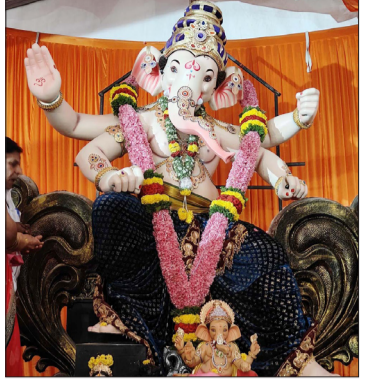
ಚಳ್ಳಕೆರೆ ಬಿಇಒ ಕಚೇರಿ ಆವರಣದಲ್ಲಿ ವಿಶ್ವಹಿಂದೂಪರಿಷತ್, ಭಜರಂಗದಳ ಸಹಯೋಗದಲ್ಲಿ ಪ್ರತಿಷ್ಠಾಪನೆಗೊಂಡ ಹಿಂದೂಮಹಾಗಣಪತಿ.

» ಬೆಂಗಳೂರು ಯುವ ಜನರನ್ನು ಸ್ವಾವಲಂಬಿಯಾಗಲು ಉತ್ತೇಜಿಸುವ ದೃಷ್ಟಿಯಿಂದ 2024-25ನೇ ಸಾಲಿಗೆ ಜಿಎಂ ಫಿಟ್ನೆಸ್, ಬ್ಯೂಟಿಷನ್, ಜಾರ್ಜ್ ತಯಾರಿಕೆ ಶಿಬಿರ ಕಾರ್ಯಕ್ರಮ ಅನುಷ್ಠಾನಗೊಳಿಸಲು ಪರಿಶಿಷ್ಟ ಜಾತಿ ಅಭ್ಯರ್ಥಿಗಳಿಂದ ಅರ್ಜಿ ಆಹ್ವಾನಿಸಲಾಗಿದೆ.ಬೆಂಗಳೂರಿನ ಶ್ರೀ ಕಂಠೀರವ ಕ್ರೀಡಾಂಗಣದಲ್ಲಿ ಸೆ.19 ರಿಂದ ಅ.3 ರವರೆಗೆ ಜಿಎಂ ಫಿಟ್ನೆಸ್ ತರಬೇತಿ, ಹಾಗೂ ಬೆಂಗಳೂರಿನ ಕೊರಮಂಗಳ ಒಳಗಣ ಕ್ರೀಡಾಂಗಣದಲ್ಲಿ ಸೆ.21 ರಿಂದ ಅ.3 ರವರೆಗೆ ಬ್ಯೂಟಿಷಿಯನ್ ಹಾಗೂ ಅ.04 ರಿಂದ 9 ರವರೆಗೆ ಜಾರ್ಜ್ ತಯಾರಿಕೆ ತರಬೇತಿ ಶಿಬಿರ ಆಯೋಜಿಸಲಾಗುವುದು. 40 ವರ್ಷ ವಯೋಮಿತಿ ಹೊಂದಿರುವ ಅರ್ಹ ಅಭ್ಯರ್ಥಿಗಳು ಸೆ.16ರ ಒಳಗೆ ಅರ್ಜಿ ಸಲ್ಲಿಸಬಹುದು. ಹೆಚ್ಚಿನ ಮಾಹಿತಿಗಾಗಿ ಕೆಕೆಐಐ ಯು ಡಿರಾಜಾಣಿ ಸಂಖ್ಯೆ: 08194-235635 ಗೆ ಸಂಪರ್ಕಿಸಿ.