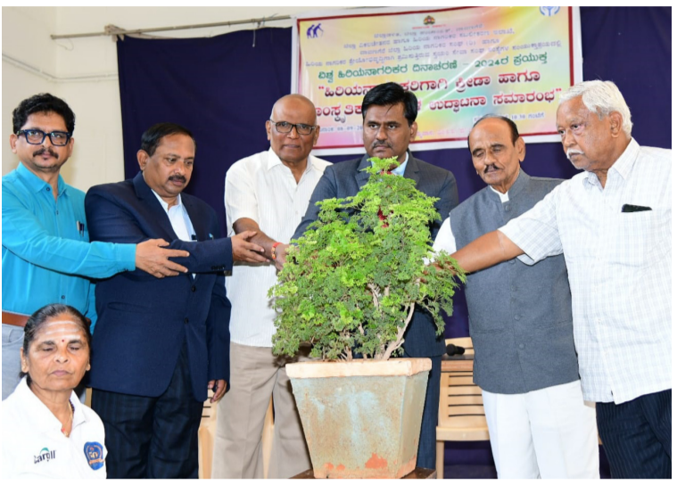
ನಡೆದ ಹಿರಿಯ ನಾಗರಿಕರಿಗಾಗಿ ದೇಶದಲ್ಲಿ ವೃದ್ಧರ ಸಂಖ್ಯೆ ಹೆಚ್ಚುತ್ತಿದೆ. ಶ್ರೀಡಾ ಕೂಟ ಹಾಗೂ ಸಾಂಸ್ಕೃತಿಕ ಸ್ಪರ್ಧೆಗಳ ಉದ್ಘಾಟನೆ ನರವೇರಿಸಿ ಸಂಘಟನೆಗಳ ಜವಾಬ್ದಾರಿಯಾಗಿದೆ. ಅವರ ಅನುಭವ, ಶಕ್ತಿ, ಸಾಮರ್ಥ್ಯಗಳನ್ನು ಮಾತನಾಡಿದರು.