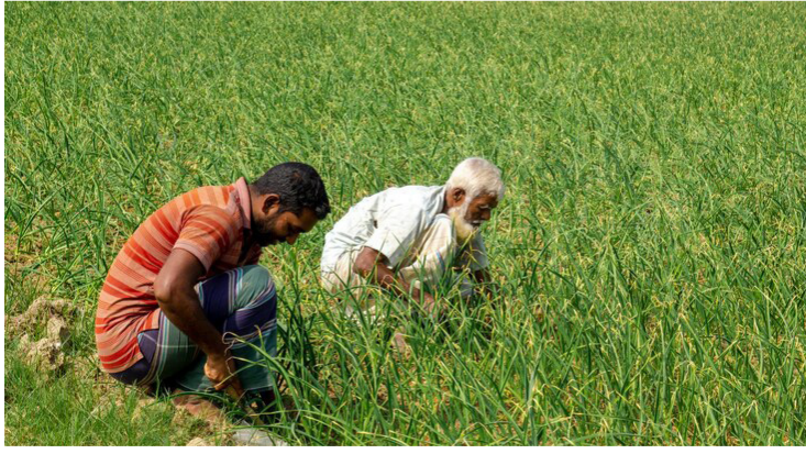
ನಲ್ಲಿ ಡೌನ್ ಲೋಡ್ ಮಾಡಲು ಅವಕಾಶ ನೀಡಲಾಗುತ್ತಿದೆ. ನೀವು ನಿಮ್ಮೊಳಗಿನ ಕೆಲವು 20 ಜಮೀನುಗಳನ್ನು ರಾಜ್ಯ ಸರ್ಕಾರದ ಕಂದಾಯ ನಕ್ಷೆಯನ್ನು ಕುಳಿತಲ್ಲೇ ಡೌನ್ ಲೋಡ್ ಮಾಡಿಕೊಳ್ಳಲು ಮುಂದಿನ ಹಂತಗಳನ್ನು ಅನುಸರಿಸಿ. ಅತಿ ಪುರಾತನ ಕಾಲದಿಂದಲೂ ಯಾವುದೇ ರೀತಿಯ ಸರ್ಕಾರದಲ್ಲಾಗಲೀ, ಅಂದರೆ, ಚಕ್ರಾಧಿಪತ್ಯ, ರಾಜಪ್ರಭುತ್ವ, ಮನವಿ/ದೂರುಗಳು ಸ್ವೀಕೃತವಾಗಿರುತ್ತವೆ. ಕಾಲದಿಂದಲೂ ಭೂನಿರ್ವಹಣೆ, ಭೂಕಂದಾಯ ಸಂಗ್ರಹಣೆ, ಭೂಮಾಲೀಕತ್ವ ನಿರ್ಬಂಧನೆ ಮತ್ತು ಭೂ ಉಪಯೋಗ ಮತ್ತು ಭೂಸ್ವಾಧೀನ ಹಕ್ಕುಗಳು ಮುಂತಾದವುಗಳೆಲ್ಲವೂ ರಾಜ್ಯ ಸರ್ಕಾರದ ಪ್ರಮುಖ ಜವಾಬ್ದಾರಿಗಳಾಗಿದ್ದವು. ಪ್ರಾಚೀನ ಭಾರತದಲ್ಲಿ ವಾಸ್ತವವಾಗಿ ಸರ್ಕಾರದಲ್ಲಿ ಎರಡು ಇಲಾಖೆಗಳು ಮಾತ್ರ ಅಸ್ತಿತ್ವದಲ್ಲಿರುತ್ತಿದ್ದವು. ಮೊದಲನೆಯದಂದರೆ ಭೂನಿರ್ವಹಣೆ ಮತ್ತು ಭೂಕಂದಾಯ ಇಲಾಖೆ ಮತ್ತು ಎರಡನೆಯದಂದರೆ ರಾಜ್ಯವನ್ನು ಬಾಹ್ಯ ದಾಳಿಯ ವಿರುದ್ಧ ಹೋರಾಡಲು ಆಗುವುದಾದ ಭೂಸೇನೆಯ ರಕ್ಷಣಾ ಇಲಾಖೆ. ಮೊದಲನೇ ಇಲಾಖೆಯು

» ಬೆಂಗಳೂರು ಕೃಷಿ ಜಮೀನಿಗೆ ಹೋಗಲು ದಾರಿ ಇಲ್ಲದ ಪರದಾಡುತ್ತಿದ್ದ ರೈತರಿಗೆ ರಾಜ್ಯ ಸರ್ಕಾರವು ಸಿಹಿಸುದ್ದಿ ನೀಡಿದ್ದು, ಕೃಷಿ ಜಮೀನಿಗೆ ದಾರಿ ನೀಡುವ ಕುರಿತು ಮಹತ್ವದ ಸೂಚನೆ ನೀಡಿದೆ.