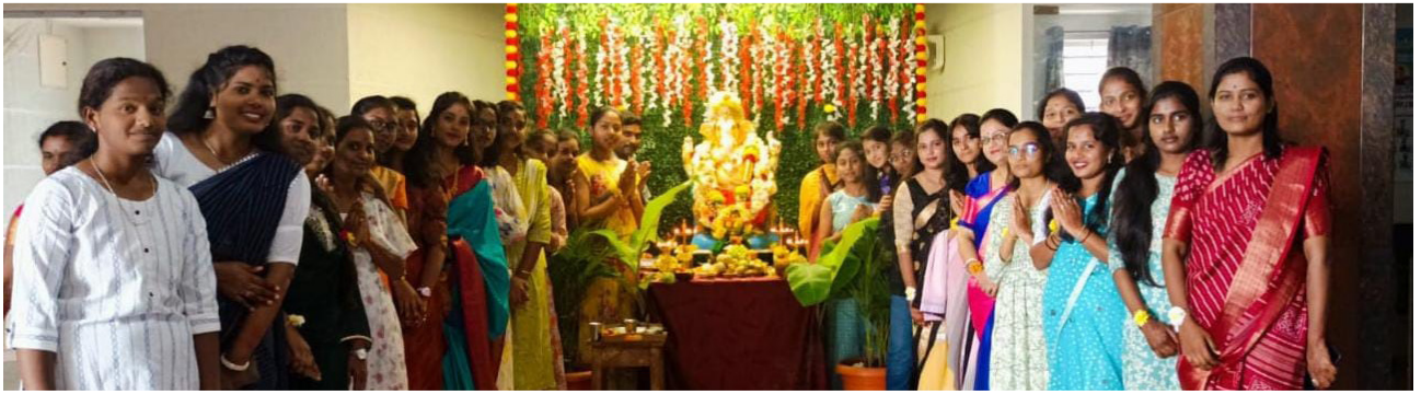
ಚಿತ್ರದುರ್ಗ ನಗರದ ನಮ್ಮ ಎಕ್ಸ್‌ಟರ್ ಪಿಯು ಕಾಲೇಜಿನಲ್ಲಿ ಬೋಧಕ ವೃಂದದವರು, ವಿದ್ಯಾರ್ಥಿಗಳು ಶನಿವಾರ ಗಣೇಶ ಪ್ರತಿಷ್ಠಾಪಿಸಿ ಭಕ್ತಿಯಿಂದ ಪೂಜಿಸಿದರು