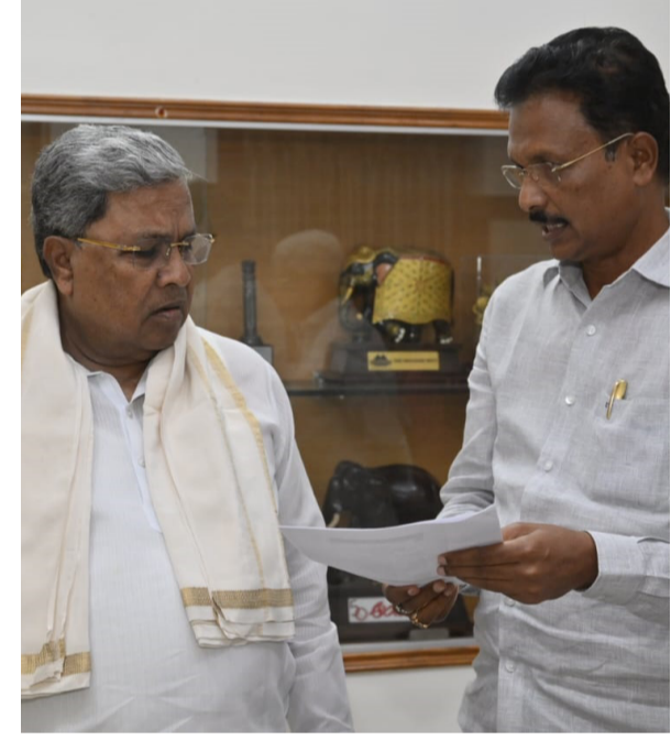
ಬಳ್ಳಾರಿ ಸಂಸದರಾದ ಈ.ತುಕಾರಾಮ್ ಅವರು ಇಂದು ಕಾವೇರಿ ನಿವಾಸದಲ್ಲಿ ಮುಖ್ಯಮಂತ್ರಿ ಸಿದ್ದರಾಮಯ್ಯ ಅವರನ್ನು ಭೇಟಿಯಾಗಿ ಸಂಸದರು ಕ್ಷೇತ್ರದ ಅಭಿವೃದ್ಧಿ ಕೆಲಸಗಳ ಕುರಿತಾಗಿ ಚರ್ಚೆ ನಡೆಸಿದರು. ಕ್ಷೇತ್ರದಲ್ಲಿ ಆಗಿರುವ ಅಭಿವೃದ್ಧಿ ಕಾರ್ಯಗಳಿಗೆ ಚಾಲನೆ ನೀಡುವುದು ಮತ್ತು ನೂತನ ಕಾಮಗಾರಿಗಳಿಗೆ ಟೆಂಡರ್ ಪ್ರಕ್ರಿಯೆ ಆರಂಭಿಸುವುದೂ ಸೇರಿ ಅಗತ್ಯ ಅನುದಾನಗಳನ್ನು ಬಿಡುಗಡೆ ಮಾಡುವಂತೆ ಮುಖ್ಯಮಂತ್ರಿಗಳಿಗೆ ಮನವಿ ಮಾಡಿದರು.

ಬದಲಾಗುವ ನಿಯಮಗಳನ್ನು ಬಾಲಕಿಯರ ಹೆಸರಿನಲ್ಲಿ ಅವರ ಅಜ್ಜ ಅಥವಾ ಅಜ್ಜಿ ಪಾಲಕರಾಗಿ (Guardian) ಸುಕನ್ಯಾ ಸಮೃದ್ಧಿ ಖಾತೆ ತೆರೆದಿದ್ದರೆ ಅದು ಸಿಂಧುವಾಗಿರುವುದಿಲ್ಲ. ಬಾಲಕಿಯ ತಂದೆ ಅಥವಾ ತಾಯಿಯ ಹೆಸರಿಗೆ ಖಾತೆಯ ಪಾಲಕತ್ವ ವರ್ಗಾವಣೆ ಆಗುತ್ತದೆ. ಅಥವಾ ಕಾನೂನು ಪ್ರಕಾರ ಯಾರು ಪಾಲಕರಾಗಿರುತ್ತಾರೋ ಅವರಿಗೆ ವರ್ಗಾವಣೆ ಆಗುತ್ತದೆ. ಒಂದು ವೇಳೆ ಬಾಲಕಿಗೆ ಅಜ್ಜ ಅಥವಾ ಅಜ್ಜಿ ಬಿಟ್ಟರೆ ಯಾರೂ ಪಾಲಕರಿಲ್ಲ ಎಂದಲ್ಲಿ ಅವರ ಹೆಸರಿನಲ್ಲಿ ಖಾತೆ ಇರುತ್ತದೆ. ವರ್ಗಾವಣೆ ಆಗುವುದಿಲ್ಲ. ಸುಕನ್ಯಾ ಸಮೃದ್ಧಿ ಯೋಜನೆಯಲ್ಲಿ ಆಗುವ ಮತ್ತೊಂದು ನಿಯಮ ಬದಲಾವಣೆ ಎರಡಕ್ಕಿಂತ ಹೆಚ್ಚು ಖಾತೆಗಳ ಕುರಿತಾದ್ದು. ಒಂದು ಕುಟುಂಬದಲ್ಲಿ ಎರಡಕ್ಕಿಂತ ಹೆಚ್ಚು ಸುಕನ್ಯಾ ಸಮೃದ್ಧಿ ಖಾತೆ ಇರುವಂತಿಲ್ಲ. ಹಾಗಾದರೆ ವೇಳೆ ಎರಡಕ್ಕಿಂತ ಹೆಚ್ಚು ಅಕೌಂಟ್‌ಗಳನ್ನು ನಿಯಮಿತವಲ್ಲದೆ ಖಾತೆ ಅಥವಾ ಖಾತೆಗಳನ್ನು ಮುಚ್ಚಲಾಗುತ್ತದೆ. ಈ ಎರಡು ನಿಯಮ ಬದಲಾವಣೆಗಳು ಅಕ್ಟೋಬರ್ 10ರಂದು ಜಾರಿಗೆ ಬರುತ್ತವೆ.