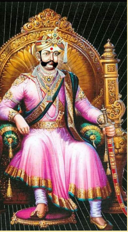
» ಮೊದಲ ಪುಟದಿಂದ

ಮದಕರಿ ನಾಯಕ ತನ್ನ ಆಳ್ವಿಕೆ ಅವಧಿಯಲ್ಲಿ ಕೈಗೊಂಡ ಹಲವು ರಾಜಕೀಯ ನಿರ್ಣಯಗಳು ಚಿತ್ರದುರ್ಗ ಸಂಸ್ಥಾನದ ಸಂಸ್ಥಾನದ ಭಾರತದ ಹಾಗೂ ವಿಶೇಷವಾಗಿ ದಕ್ಷಿಣ ಏಷ್ಯಾದಲ್ಲಿ ಹರಡಲು ಕಾರಣ ಇವೆನಿಸಿದವು. ಮದಕರಿನಾಯಕನ ಆಳ್ವಿಕೆಯಿಂದಾಗಿಯೇ ಚಿತ್ರದುರ್ಗ ಸಂಸ್ಥಾನವು ಭಾರತದಲ್ಲಿ ಪರಾಕ್ರಮಿ ಆಳ್ವಿಕೆ ಹೊಂದಿದ ಮತ್ತು ಅತ್ಯಂತ ಬಲಿಷ್ಠ ಸೈನ್ಯದಿಂದ ಹೆಚ್ಚು ಪ್ರಭುತ್ವವನ್ನು ಬರಲು ಸಾಧ್ಯವಾಯಿತು. ಅತಿ ಮುಖ್ಯವಾಗಿ ಶ್ರೀರಂಗಪಟ್ಟಣದ ನವಾಬರು ಮತ್ತು ಮರಾಠಾ ಪೇಶ್ವಾಕೋಡನ ಈ ನಾಯಕನು ಇಟ್ಟುಕೊಂಡಿದ್ದ ರಾಜಕೀಯ ಬಾಂಧವ್ಯ ಮತ್ತು ನಡವಳಿ ಹೋರಾಟಗಳು ಆತನ ರಾಜಕೀಯ ದೂರದೃಷ್ಟಿ ಹಾಗೂ ಶೌರ್ಯ- ಸಾಹಸಗಳನ್ನು ಪ್ರತಿನಿಧಿಸುತ್ತವೆ. ತನ್ನ ಬದುಕಿನ ಹೆಚ್ಚಿನ ಸಮಯವನ್ನು ಯುದ್ಧಗಳಲ್ಲಿ ಭಾಗಿಯಾಗುತ್ತಿದ್ದ ಮದಕರಿನಾಯಕರ ಸಂಸ್ಥಾನವನ್ನು ಬಲಪಡಿಸುವಲ್ಲಿ, ರಾಜ್ಯವನ್ನು ಸುಭಿಕ್ಷೆಯಿಂದ ಇಟ್ಟುಕೊಳ್ಳುವಲ್ಲಿ ವಹಿಸುತ್ತಿದ್ದ ಪಾತ್ರ ವಿಶೇಷವಾದದ್ದಾಗಿದೆ. ಸ್ವಾಭಿಮಾನಿ, ಸಾಹಸಿ, ನಿರ್ಭೀತ ನಡವಳಿ ಮದಕರಿ ದುರ್ಗದ ಮಣಿಗೆ ಸಾಂಸ್ಕೃತಿಕ ಮಹತ್ವ ತಂದುಕೊಡುವಲ್ಲಿ ಮಹತ್ವದ ಪಾತ್ರವಹಿಸಿದವನು. ಸುತ್ತಲಿನ ಹರಪನಹಳ್ಳಿ, ರಾಯದುರ್ಗ, ಬಿದನೂರು, ಸವಣೂರು ಮುಂತಾದ ಸಂಸ್ಥಾನಿಕರೊಂದಿಗೆ ನಿರಂತರ ಕಾಳಗಗಳಲ್ಲಿ ನಿರತನಾಗಿರುತ್ತಿದ್ದ ಹೈದರಾಲಿಯೊಂದಿಗೆ ವಿಶೇಷ ಸ್ನೇಹ ಇರಿಸಿಕೊಂಡಿದ್ದ ಮದಕರಿ ಆತನ ದಂಡಯಾತ್ರಿಗಳಲ್ಲಿ ಫಾಲೋವರ್ ಅನೇಕ ಬಗೆಯಲ್ಲಿ ಸಹಾಯ ಮಾಡಿದ. ಕೊನೆಯಲ್ಲಿ ಹೈದರ್ ಕಣ್ಣು ದುರ್ಗದ ಮೇಲೆ ಬಿದ್ದು ಚಿತ್ರದುರ್ಗದ ಮೇಲೆಯೂ ದಂಡೆತ್ತಿ ಬಂದ. ನಾಲ್ಕು ಬಾರಿ ದುರ್ಗದ ಮೇಲೆ ಯುದ್ಧ ಮಾಡಿದ. ಕೊನೆಯ ಯುದ್ಧ 1779ರ ಫೆಬ್ರವರಿಯಲ್ಲಿ ಪ್ರಾರಂಭವಾಗಿ ನಾಲ್ಕು ತಿಂಗಳುಗಳ ಕಾಲ ನಡೆದು ಮೇ ತಿಂಗಳಲ್ಲಿ ದುರ್ಗದ ಪತನದೊಂದಿಗೆ ಅಂತ್ಯವಾಯಿತು. ರಾಜವೀರ ಮದಕರಿ ನಾಯಕನ ಕುರಿತಂತೆ ಸಮಕಾಲೀನ ಕವಿ ಚಂದ್ರಭೀಮನ 'ಮದಕರಿ ರಾಜೇಂದ್ರನ ದಂಡಕ', 'ಭೀಮಾಜಿ ಪಂತನ', 'ಚಿತ್ರದುರ್ಗದ ಬಟ್ಟರು' ಹಾಗೂ ಚಿನ್ನದಮನ ರಾಮಪ್ಪನ 'ಚಿನ್ನೂರಾದಿ ಗಿರಿದುರ್ಗದಲ್ಲಿ ಆಳಿದ ಹಿಂದಿನ ಆರಸರು ಕೃತಿಗಳು ವಸ್ತುನಿಷ್ಠ ಮಾಹಿತಿಗಳನ್ನು ನೀಡುತ್ತವೆ.