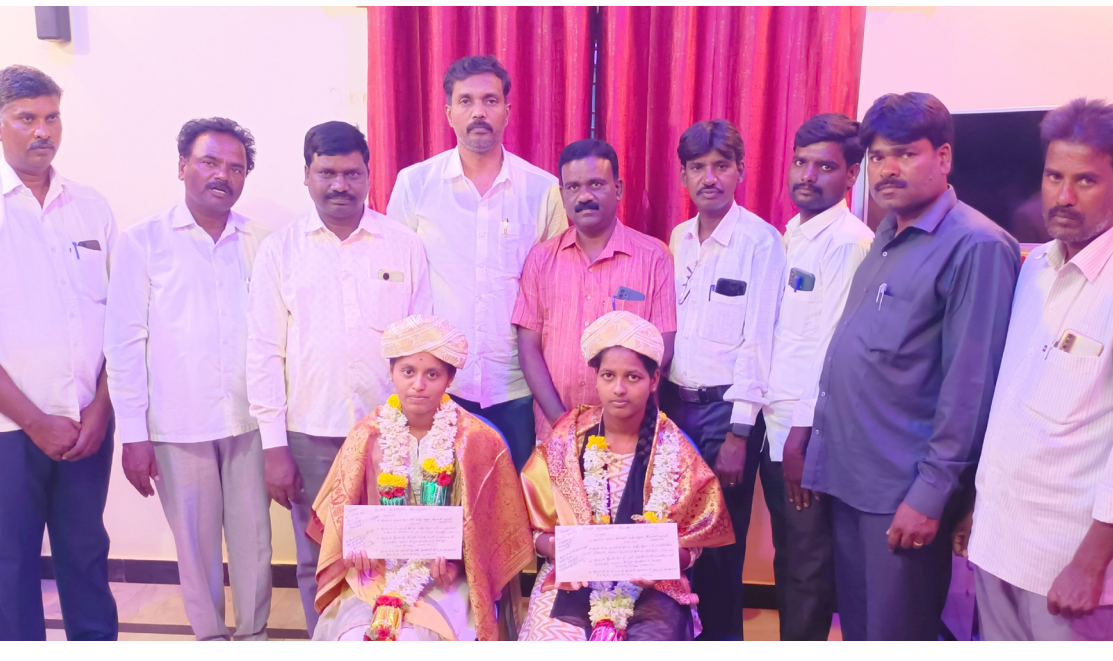
ಜಾರಿಗೆ ತಂದಿದೆ. ಇದನ್ನು ಸಮರ್ಪಕವಾಗಿ ಬಳಕೆ ಮಾಡಿಕೊಂಡು ತಮ್ಮ ಮಕ್ಕಳ ಶೈಕ್ಷಣಿಕ ಪ್ರಗತಿಗೆ ಪ್ರೋತ್ಸಾಹ ನೀಡಬೇಕು ಎಂದು ಮಕ್ಕಳಲ್ಲಿ ಉತ್ತಮ ಸಂಸ್ಕೃತಿ, ಸಂಸ್ಕಾರ ಬೆಳೆಸಲು ಶಿಕ್ಷಣ ಸರ್ಕಾರಿಯಾಗಿದೆ. ಹೀಗಾಗಿ ಎಲ್ಲ ಮೋಷಕರು, ಶಿಕ್ಷಕರು ಕಾಳಜಿ ವಹಿಸಬೇಕು. ಸೀಮಿತ ಸಮುದಾಯದ ವಿದ್ಯಾರ್ಥಿಗಳಿಗೆ ಪ್ರೋತ್ಸಾಹ ನೀಡುವುದರ ಜೊತೆಗೆ ಇತರ ಎಲ್ಲಾ ಸಮುದಾಯದ ಬಡಮಕ್ಕಳಲ್ಲಿನ ಪ್ರತಿಭೆಯನ್ನು ಗುರುತಿಸಿ ಪ್ರೋತ್ಸಾಹ ನೀಡುವ ಕೆಲಸ ಹೆಚ್ಚಾಗಬೇಕೆಂದು ಮಕ್ಕಳಿಗೆ ಪ್ರೋತ್ಸಾಹ