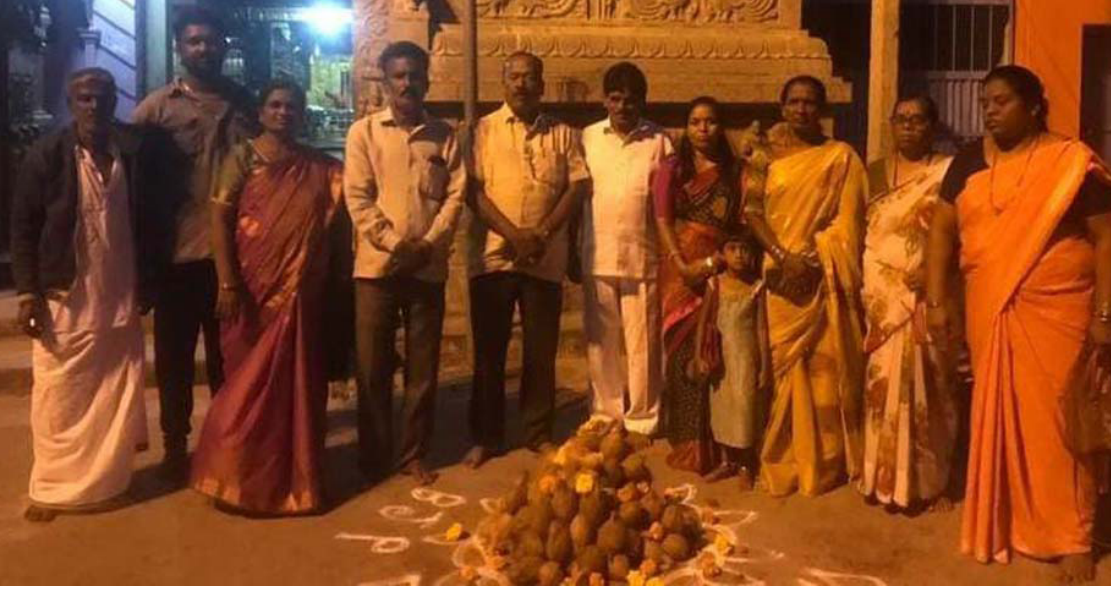
ಮೂಲಕ ಅಧಿಪತಿಸುತ್ತಿದ್ದವು. ಕಳೆದ ಸಾಧನೆಯನ್ನು ವಿಶ್ವವೇ ಮೆಚ್ಚಿದ್ದರೂ ಅಪಪ್ರಚಾರದ ಅಸ್ತ್ರ ಪ್ರಯೋಗಿಸಿದರು. ಆದರೆ, ರಾಷ್ಟ್ರದ ಮೆತದಾರ ಮತ್ತೊಮ್ಮೆ ಉಪಸ್ಥಿತರಿದ್ದರು.