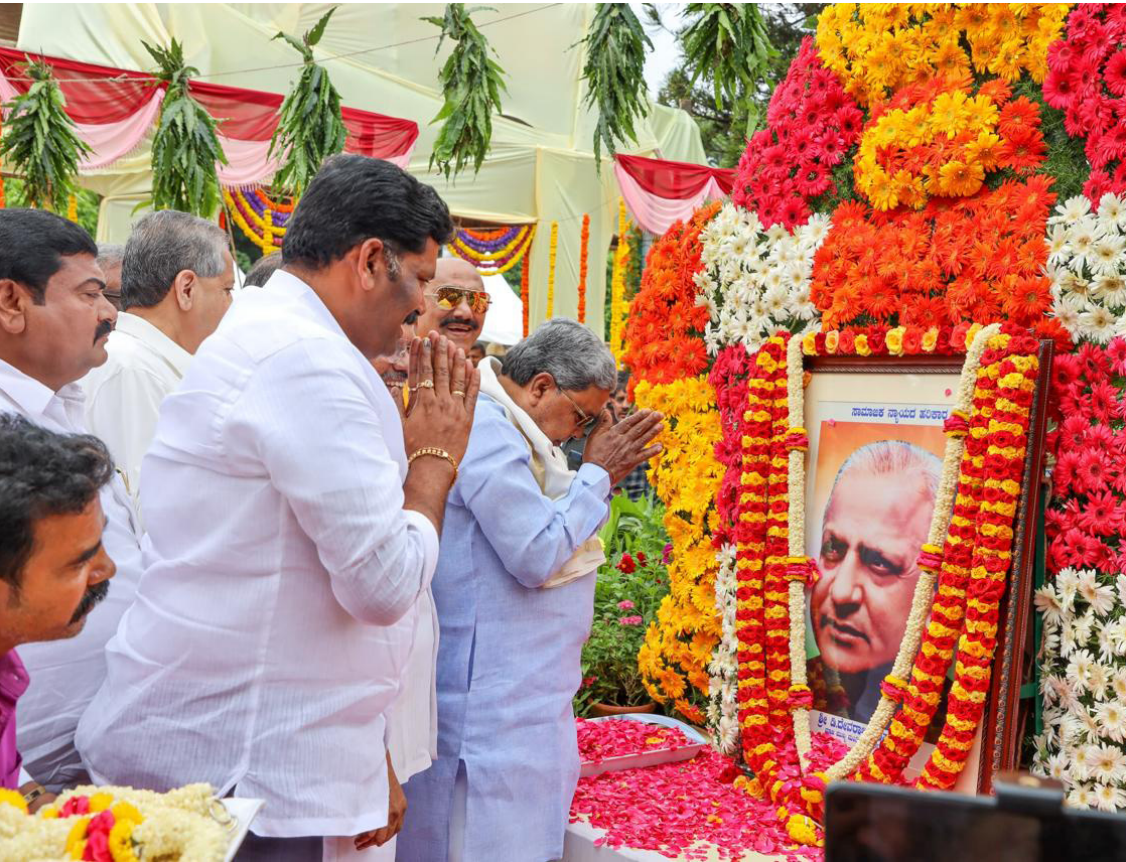
ಮಾನ್ಯ ಮುಖ್ಯಮಂತ್ರಿ ಸಿದ್ದರಾಮಯ್ಯ ಅವರು ಹಿಂದುಳಿದ ವರ್ಗಗಳ ಕಲ್ಯಾಣ ಇಲಾಖೆಯ ವತಿಯಿಂದ ಆಯೋಜಿಸಲಾಗಿದ್ದ ವಿಧಾನಸೌಧ ಪ್ರತಿಮೆ ದ್ವಾರದ ಬಳಿ ಇರುವ ಮಾಜಿ ಮುಖ್ಯಮಂತ್ರಿಗಳಾದ ದಿವಂಗತ ದೇವರಾಜ ಅರಸುರವರ 42ನೇ ಪುಣ್ಯಸ್ಮರಣೆ ಅಂಗವಾಗಿ ಅವರ ಪ್ರತಿಮೆಗೆ ಮಾಲಾರ್ಪಣೆ ಮಾಡಿದರು.

» ಬೆಂಗಳೂರು ದೇವರಾಜ ಅರಸು ಅವರು ಕಾಂಗ್ರೆಸ್ ಪಕ್ಷದ ಪ್ರಮುಖ ನಾಯಕರಾಗಿ ಈ ರಾಜ್ಯದಲ್ಲಿ ಬದಲಾವಣೆ ತರಲು ಪ್ರಯತ್ನಿಸಿದರು. ಅವರ ಹಾದಿಯಲ್ಲಿಯೇ ನಡೆಯುವ ಪ್ರಯತ್ನವನ್ನು ನಮ್ಮ ಸರ್ಕಾರವೂ ಮಾಡುತ್ತದೆ. ಅದೇ ನಾವು ಅವರಿಗೆ ಸಲ್ಲಿಸುವ ಗೌರವ ಎಂದು ಮುಖ್ಯಮಂತ್ರಿ ಸಿದ್ದರಾಮಯ್ಯ ತಿಳಿಸಿದರು. ಅವರು ಗುರುವಾರ ಹಿಂದುಳಿದ ವರ್ಗಗಳ ಕಲ್ಯಾಣ ಇಲಾಖೆಯ ವತಿಯಿಂದ ಆಯೋಜಿಸಲಾಗಿದ್ದ ಕಾರ್ಯಕ್ರಮದಲ್ಲಿ ವಿಧಾನಸೌಧ ಪ್ರತಿಮೆ ದ್ವಾರದ ಬಳಿ ಇರುವ ಮಾಜಿ ಮುಖ್ಯಮಂತ್ರಿಗಳಾದ ದಿವಂಗತ ದೇವರಾಜ ಅರಸುರವರ 42ನೇ ಪುಣ್ಯಸ್ಮರಣೆ ಅಂಗವಾಗಿ ಅವರ ಪ್ರತಿಮೆಗೆ ಮಾಲಾರ್ಪಣೆ ಮಾಡಿ ನಂತರ ಮಾಧ್ಯಮದವರೊಂದಿಗೆ ಮಾತನಾಡಿದರು. ದೇವರಾಜ ಅರಸು ಅವರು ಒಬ್ಬ ಜಾತ್ಯಾತೀತ ವ್ಯಕ್ತಿ. ಸಾಮಾಜಿಕ ನ್ಯಾಯದ ಹರಿಕಾರ. ಮುಖ್ಯಮಂತ್ರಿಯಾಗಿದ್ದ ಸಂದರ್ಭದಲ್ಲಿ ಅನೇಕ ಜನಪರ ಯೋಜನೆಗಳನ್ನು ಜಾರಿಗೆ ತಂದಿದ್ದರು. ಸಮಾಜದ ತಳವರ್ಗದ ಜನರನ್ನು ಆರ್ಥಿಕವಾಗಿ, ಸಾಮಾಜಿಕವಾಗಿ ಹಾಗೂ ರಾಜಕೀಯವಾಗಿ ಮೇಲಕ್ಕೆತ್ತುವ, ಮುಖ್ಯವಾಗಿ ತರಲು ಪ್ರಯತ್ನ ಮಾಡಿದರು. ಹಾವನೂರು ಆಯೋಗವನ್ನು ರಚಿಸಿ ಹಿಂದುಳಿದ ವರ್ಗಗಳಿಗೆ ಶಿಕ್ಷಣ ಮತ್ತು ಉದ್ಯೋಗ ಕ್ಷೇತ್ರದಲ್ಲಿ ಮೀಸಲಾತಿ