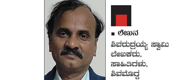
ಲೇಖನ ಶಿವರುದ್ರಯ್ಯ ಸ್ವಾಮಿ ಲೇಖಕರು, ಸಾಹಿತಿಗಳು, ಶಿವಮೊದ್ದ

A rasu25-08-16 ಅಪರಾಹ್ನ 12:40ಅರಸು ಎಂದರೆ ನನಗೆ ನೆನಪಾಗುವುದು ಭೀಮಸದೃಶ ನೀಳ ಕಾಯದ ಮೃದು ನಗೆಯ ಬೆಣ್ಣೆಯ ಮೊಗದ ಸುಸ್ವರೂಪ ಮತ್ತು ಮೊದಲ ನೋಟದಲ್ಲೇ ಆಗಾಧವೆನಿಸುವ ಆದರೆ ಸೂಜಿಗಲ್ಲಿನಂತೆ ಹತ್ತಿರ ಸೆಳೆಯುವ ವ್ಯಕ್ತಿತ್ವ. ಈಗಲೂ ನನಗೆ ಅವರ ಮೊದಲ ಭೇಟಿ ಸುಟ , ಸುಸ್ವಪ್ನ ಅದು 1978 ರ ಅಕ್ಟೋಬರ್ ತಾಲೆ ರಜೆಯ ದಿನಗಳು. ಆಗ ನಾನು ಉತ್ತರ ಕನ್ನಡ ಜಿಲ್ಲೆಯ ಹಳಿಯಾಳ ಎಂಬ ಪುಟ್ಟ ಪಟ್ಟಣದ ಸರ್ಕಾರಿ ಶಾಲೆಯಲ್ಲಿ 5 ನೇ ಇಯತ್ತೆ ವಿದ್ಯಾರ್ಥಿ. ನನ್ನ ತಂದೆ ಹಳಿಯಾಳ ತಾಲೂಕಿನ ಕ್ಷೇತ್ರಾಭಿವೃದ್ಧಿ ಅಧಿಕಾರಿ. ಮೈಸೂರಿನಲ್ಲಿ ಕ್ಷೇತ್ರಾಭಿವೃದ್ಧಿ ಅಧಿಕಾರಿಗಳ ರಾಜ್ಯ ಸಮ್ಮೇಳನ. ಆ ಸಮ್ಮೇಳನದಲ್ಲಿ ಭಾಗಿಯಾಗಬೇಕೆಂದ ನನ್ನ ತಂದೆ ನನ್ನನ್ನು ಜೊತೆಗೆ ಕರೆದೊಯ್ದಿದ್ದರು. ಆ ಕಾರ್ಯಕ್ರಮವನ್ನು ದೈನಂದಿನ ಅಂದಿನ ಮುಖ್ಯಮಂತ್ರಿ ಶ್ರೀ ದೇವರಾಜ ಅರಸುವರು