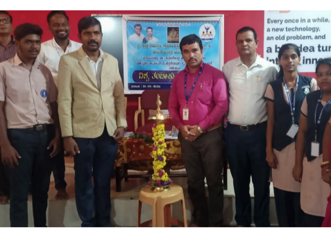
ವಿದ್ಯಾರ್ಥಿಗಳ ಪೋಷಕರು ಧರ್ಮಸ್ಥಳ ಸಂಘಕ್ಕೆ ಸೇರುವುದರಿಂದ ಇರುವ ಸೌಭಾಗ್ಯಗಳ ಬಗ್ಗೆ ಮಾಹಿತಿ