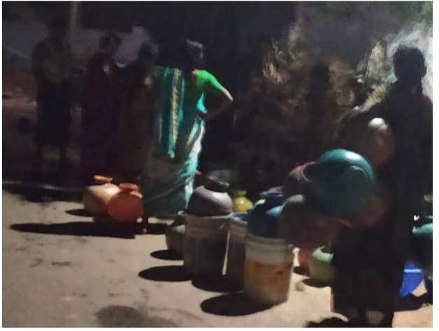
ಸಂಬಂಧಪಟ್ಟಂತೆ ಸಂಬಂಧಪಟ್ಟ ಗಮನಹರಿಸುತ್ತಿಲ್ಲ, ವಿಶೇಷವಾಗಿ ಪಂಚಾಯತಿ ಅಭಿವೃದ್ಧಿ ಅಧಿಕಾರಿ ನಿರೀಕ್ಷಿಸಿ ವ್ಯವಸ್ಥೆ ಇಲ್ಲ.