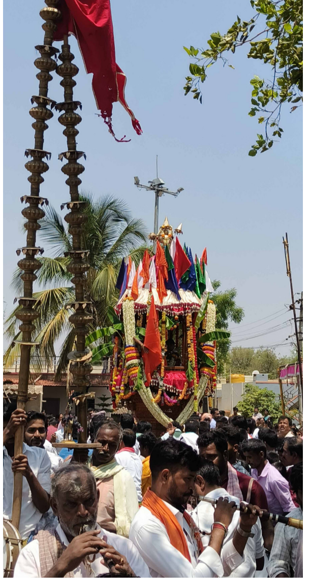
ಚಿತ್ರದುರ್ಗ ತಾಲ್ಲೂಕಿನ ಚಿಕ್ಕಪ್ಪನಹಳ್ಳಿ ಗ್ರಾಮದ ಶ್ರೀ ಗುರುಕೊಟ್ಟಸ್ವಾಮಿ ರಥೋತ್ಸವ ಮಂಗಳವಾರ ಸಹಸ್ರಾರು ಭಕ್ತಾದಿಗಳ ನಡುವೆ ವಿಜೃಂಭಣೆಯಿಂದ ನೆರವೇರಿತು.

ತಾಲ್ಲೂಕು ಆಡಳಿತ ಈ ಹಿಂದೆ ಪ್ರತಿದಿನ ಐದು ಟ್ಯಾಂಕ್‌ಗಳಲ್ಲಿ ಕುಡಿಯುವ ನೀರಿನ ವ್ಯವಸ್ಥೆ ಮಾಡಿತ್ತು. ಆದರೆ, ಈಗ ಇಡೀ ದಿನಕ್ಕೆ ಕೇವಲ ಒಂದು ಟ್ಯಾಂಕ್ ಮಾತ್ರ ಬಂದುಹೋಗುತ್ತದೆ. ಟ್ಯಾಂಕ್ ಬಂದಕೂಡಲೇ ನೂರಾರು ಮಹಿಳೆಯರು ಕುಡಿಯುವ ನೀರಿಗೆ ಮುಗಿಬೀಳುತ್ತಾರೆ. ಮನೆಯಲ್ಲಿ ವೃದ್ಧರು, ಮಕ್ಕಳು, ಮಹಿಳೆಯರು ಕುಡಿಯುವ ನೀರಿಲ್ಲದೆ ಪ್ರತಿನಿತ್ಯ ಪರದಾಡುತ್ತಾರೆ. ತಾಲ್ಲೂಕು ಆಡಳಿತ ಈ ಬಗ್ಗೆ ತುರ್ತು ಗಮನಹರಿಸಿ ಕುಡಿಯುವ ನೀರಿನ ವ್ಯವಸ್ಥೆ ಮಾಡಬೇಕೆಂದು ಗ್ರಾಮಸ್ಥರು ಸರ್ಕಾರವನ್ನು ಆಗ್ರಹ ಪಡಿಸಿದ್ದಾರೆ.