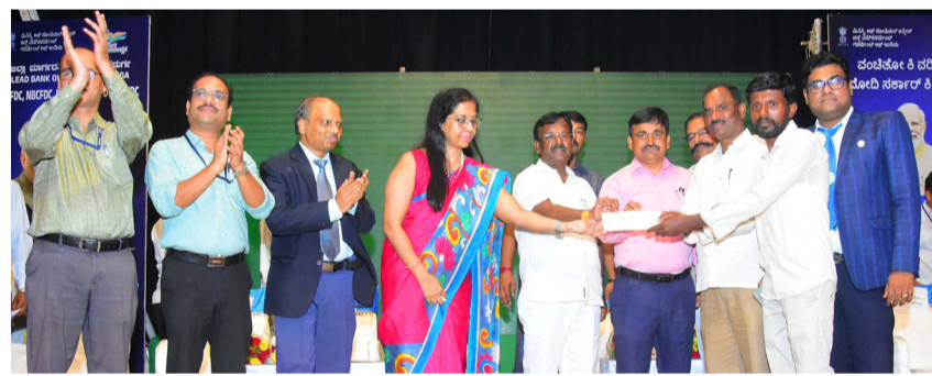
ಜನಪ್ರತಿನಿಧಿಗಳು ಮಾಡಬೇಕು ಎಂದು ಹೇಳಿದರು.ಪರಿಶಿಷ್ಟ ಜಾತಿ, ಪರಿಶಿಷ್ಟ ಪಂಗಡದ ಹಾಗೂ ಹಿಂದುಳಿದ ವರ್ಗಗಳು, ಸಫಾಯಿ ಕರ್ಮಚಾರಿಗಳು ಸೇರಿದಂತೆ ಎಲ್ಲ ವರ್ಗಗಳ ಸಮುದಾಯಕ್ಕೆ ಅವರ ಸ್ವಂತ ವ್ಯವಹಾರಗಳನ್ನು ಪ್ರಾರಂಭಿಸಲು ಕೇಂದ್ರ ಸರ್ಕಾರದ ಆರ್ಥಿಕ ಸಹಾಯವನ್ನು ವಿವಿಧ ರಾಜ್ಯಗಳ ಆಯಾ ಬ್ಯಾಂಕ್‌ಗಳ ಮೂಲಕ ಸಾಲ ವಿತರಣೆ ಮಾಡುವ

» ಜಿತ್ರದುರ್ಗ ಬಡವರು, ಶೋಷಿತ ವರ್ಗಗಳ ಆರ್ಥಿಕಾಭಿವೃದ್ಧಿ ಚಟುವಟಿಕೆಗಳಿಗಾಗಿ ಸಾಲ-ಸೌಲಭ್ಯ ನೀಡುವ ನಿಟ್ಟಿನಲ್ಲಿ ಬ್ಯಾಂಕ್‌ಗಳು ಬಡವರ ಹೆಬ್ಬಾಗಿಲಾಗಬೇಕು. ಬ್ಯಾಂಕ್‌ಗಳು ಬಡವರ ಹೆಬ್ಬಾಗಿಲಾಗದೇ ಮಾತ್ರ ದೇಶದಲ್ಲಿ ಪರಿವರ್ತನೆಯಾಗಲು ಸಾಧ್ಯ ಎಂದು ಕೇಂದ್ರ ಸಾಮಾಜಿಕ ನ್ಯಾಯ ಮತ್ತು ಸಬಲೀಕರಣ ಖಾತೆ ರಾಜ್ಯ ಸಚಿವ ಹಾಗೂ ಸಂಸದರಾದ ಎ.ನಾರಾಯಣಸ್ವಾಮಿ ಅವರು ಹೇಳಿದರು. ನಗರದ ತರಾಸು ರಂಗಮಂದಿರದಲ್ಲಿ ಬುಧವಾರ ಹಮ್ಮಿಕೊಂಡಿದ್ದ ಪಿಎಂ-ಸೂರಜ್ ನ್ಯಾಷನಲ್ ಫೋರ್ಬ್ಸ್‌ನ ಉದ್ಘಾಟನೆ ಹಾಗೂ ಗ್ರಾಹಕ ಸಂಪರ್ಕ ಮೇಳ ಉದ್ಘಾಟಿಸಿ ಅವರು ಮಾತನಾಡಿದರು. ಗ್ರಾಹಕ ಸಂಪರ್ಕ ಮೇಳದಂತಹ ಕಾರ್ಯಕ್ರಮಗಳು ನಿಂತ ನಿರೀಕ್ಷೆಗಳಿಗಿಂತ ತೆರಿಗೆ ಹಣವನ್ನು ಬಡವರ ಮನೆ ಬಾಗಿಲಿಗೆ ಕೊಂಡೊಯ್ಯುವ ಸಂಕಲ್ಪ ಎಲ್ಲ ಸರ್ಕಾರಗಳು,