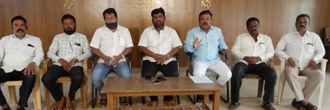
ರವರು ದೇಶದ ದಲಿತರು, ಶೋಷಿತರು, ಹಿಂದುಳಿದವರ್ಗ, ಅಲ್ಪಸಂಖ್ಯಾತರು, ಆದಿವಾಸಿಗಳೇ ಹೆಚ್ಚಾಗಿರುವ ಈ ದೇಶದಲ್ಲಿ ಸಂವಿಧಾನವನ್ನು ಬದಲಾವಣೆಯ ಅಥವಾ ತಿದ್ದುಪಡಿಯ ಮಾತನಾಡುವುದು ದೇಶದ್ರೋಹ ಕೃತ್ಯವಾಗಿದ್ದು, ಈ ಪದವನ್ನು ಯಾರೇ ಮಾತನಾಡಿದರೂ ಕೂಡ ಪ್ರಚೋದಕಾರಿ ಶಕ್ತಿಗಳೆಂದು ಪರಿಗಣಿಸಿ ಅವರ ವಿರುದ್ಧ ತ್ರಿಮೂರ್ತಿ ಮೊಕದ್ದಮೆ ದಾಖಲಿಸಿ ಬಂಧಿಸಬೇಕೆಂದು ಸಂವಿಧಾನಪರ ಸಂಘಟನೆಗಳು ಆಗ್ರಹಿಸುತ್ತದೆ.ದೇಶದಲ್ಲಿ ವೈದಿಕ ಸಂಸ್ಕೃತಿಯೇ ವಿಜೃಂಭಣೆ ಮಾಡುತ್ತಿದ್ದ ಕಾಲಘಟ್ಟದಲ್ಲಿ, ಸಮಾನತೆ, ಸಹಬಾಳೆ, ಸಹೋದರತೆ, ಸೌಹಾರ್ದತೆಗೆ ಬೆಲೆಯಿಲ್ಲದಂತಹ ಸಂದರ್ಭದಲ್ಲಿ ಡಾ. ಬಾಲಾಸಾಹೇಬ್ ಅಂಬೇಡ್ಕರ್‌ನು ಭಾರತದ ಸಂವಿಧಾನವನ್ನು ರಚಿಸುವ ಮೂಲಕ ಎಲ್ಲರಿಗೂ ಸಮಾನತೆಯನ್ನು ನೀಡಿದ್ದಾರೆ. ತತ್ತ್ವ ಆದರ್ಶಗಳಡಿಯಲ್ಲಿ ಸಂವಿಧಾನದ ಪ್ರೀತಿಯಲ್ಲಿ ಹೇಳುವಂತೆ ದೇಶದ ಪ್ರಜೆಗಳಾದ ನಾವೆಲ್ಲರೂ ಸಮಾನರು ಎಂಬ ಬಹುದೊಡ್ಡ ಸಂದೇಶವನ್ನು ಸಾರಿದಂತಹ ಡಾ|| ಬಾಲಾಸಾಹೇಬ್ ಅಂಬೇಡ್ಕರ್‌ನ ಸಂವಿಧಾನವನ್ನು ತಿದ್ದುಪಡಿ ಮಾಡುವುದಾಗಿ, ರದ್ದುಪಡಿಸುವುದಾಗಿ ಮೂರ್ಖ ಹೇಳಿಕೆಗಳನ್ನು ನೀಡುವ ಮೂಲಕ ಪ್ರಚಾರವನ್ನು ಪಡೆಯುತ್ತಿರುವ ಸಂಸದ ಅನಂತ ಕುಮಾರ್ ಹೆಗ್ಡೆ ರವರನ್ನು, ತತ್ತ್ವಗಳಿಂದ ಬಂಧಿಸಿ, ಜೈಲಿಗಟ್ಟಬೇಕು. ಇಲ್ಲವಾದರೆ ಮುಂದಿನ ದಿನಗಳಲ್ಲಿ ಸಮಾಜದ ಸ್ವಾಸ್ಥ್ಯವನ್ನು ಕೆಡಿಸುವಂತಹ ಷಡ್ಯಂತ್ರವನ್ನು ಮಾಡುವ