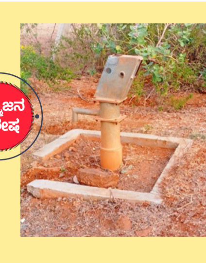
ಗ್ರಾಮೀಣ ಭಾಗದ ಜನರು ನೀರಿಸಿದರು. ಅಲ್ಲದೆ ಬೇಸಿಗೆಯಲ್ಲಿ ನೀರಿನ ಬರ ತಟ್ಟುತ್ತಿರುವುದರಿಂದ ಮತ್ತೇ ಜನರು ಅವುಗಳ ಬಳಕೆಗೆ ಆಶ್ರಯಿಸುವಂತಾಗಿದೆ.