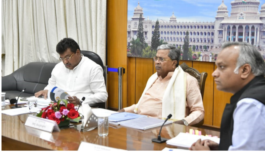
ಚಿತ್ರದುರ್ಗದ ಸುರಂಗ ನಿರ್ಮಾಣ ಮಾಡಿದ ಕಾಮಗಾರಿ ತೋರಿಸಿ ವಿವಿ ಸಾಗರಕ್ಕೆ ನೀರು ಹರಿಸಲಾಗಿದೆ ಎಂಬ ಭರವಸೆ ಮೂಡಿಸಿದ್ದಾರೆ. ಆದರೆ ಭದ್ರಾ ಮೇಲ್ವಿಚಾರಣೆ ಕಾಮಗಾರಿ ಇದೊಂದೇ ಉದ್ದೇಶ ಹೊಂದಿಲ್ಲವೆಂಬ ಸಂಗತಿ ಸರ್ಕಾರ ಅರಿಯಬೇಕು. ಚಿತ್ರದುರ್ಗ ಶಾಖಾ ಕಾಲುವೆ ನಿರ್ಮಾಣದ ಕಾಮಗಾರಿಯನ್ನು 1682 ಕೋಟಿ ರೂಪಾಯಿ ವೆಚ್ಚದಲ್ಲಿ 12 ಪ್ಯಾಕೇಜ್ ಗಳಲ್ಲಿ ಕೈಗೆತ್ತಿಕೊಳ್ಳಲಾಗಿದ್ದು ಎಲ್ಲವೂ ಆರ ಬರೆಯಾಗಿದೆ. ತುಮಕೂರು ಶಾಖಾ ಕಾಲುವೆಯ ಐದು ಪ್ಯಾಕೇಜ್