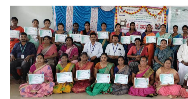
ಚಿತ್ರದುರ್ಗ ತಾಲ್ಲೂಕಿನ ಕೊನೆಬೀವೆ ಕಾರ್ಯಕ್ಷೇತ್ರದ ಜ್ಞಾನವಿಕಾಸ ಕೇಂದ್ರದಲ್ಲಿ ಮೂರು ತಿಂಗಳು ನಡೆದ ಟೈಲರಿಂಗ್ ತರಬೇತಿ ಸಮಾರೋಹ ಸಮಾರಂಭದಲ್ಲಿ ಶರಣ್‌ಫಿಟ್‌ಗಳನ್ನು ವಿತರಿಸಿದರು.