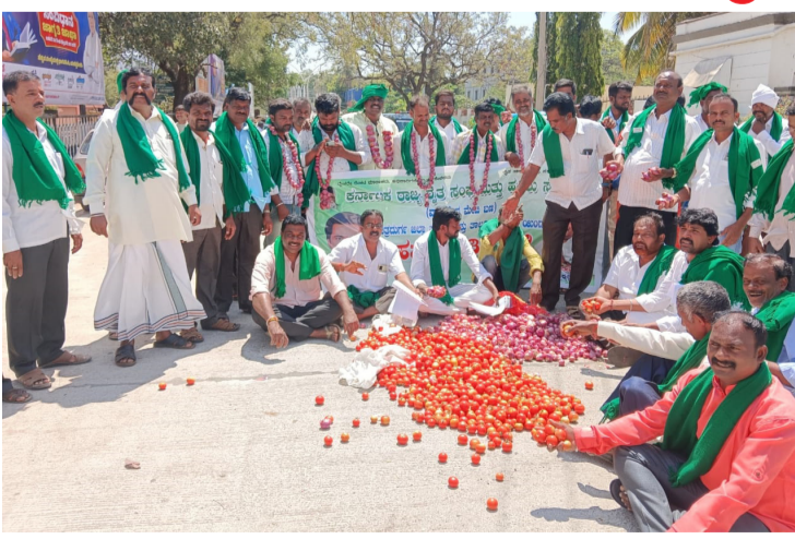
ಬೆಳೆಗಳಿಗೆ ಬೆಳೆವಿಮೆ ಹಣವನ್ನು ಶೀಘ್ರವಾಗಿ ಬಿಡುಗಡೆ ಮಾಡಬೇಕು. ಈರುಳ್ಳಿ, ಮೆಕ್ಕೆಜೋಳ ರೂ. 4,000ರೂ ಗಳನ್ನು ನಿಗದಿ ಮಾಡಬೇಕು, ಮೆಕ್ಕೆಜೋಳ 1 ಕ್ವಿಂಟಾಲ್‌ಗೆ ರೂ. 3000 ರೂ ಬೆಲೆಯನ್ನು ನಿಗದಿಪಡಿಸಬೇಕು ಟಮೋಟಾಗೆ 1 ಬಾಕ್ಸ್ ರೂ. 1000 ನಿಗದಿ ಮಾಡಬೇಕು. ಸಾಗುವಳಿ ಮಾಡಿರುವಂತೆ ರೈತರ ಪೋಡಿ ದುರಸ್ತಿ ಮಾಡಿಕೊಡಬೇಕು. ಡಾಕ್ಟರ್ ಸ್ವಾಮಿನಾಥನ್ ವರದಿ ಜಾರಿ ಮಾಡಬೇಕು, ರೈತರ ಬೆಳೆಗೆ ಕಾನೂನಾತ್ಮಕ ದರ ನಿಗದಿ ಮಾಡಬೇಕು. ಸರ್ಕಾರ ಬರಪೀಡಿತ ಎಂದು ಘೋಷಣೆ ಮಾಡಿದ್ದರು. ಖಾಸಗಿ ಬ್ಯಾಂಕ್ ಮತ್ತು ರಾಷ್ಟ್ರೀಕೃತ ಬ್ಯಾಂಕಿನವರು

» ಚಿತ್ರದುರ್ಗ ಭದ್ರಾ ಮೇಲ್ಮಂಡಲ ಯೋಜನೆ ಕಾಮಗಾರಿಗೆ ಕೇಂದ್ರ ಸರ್ಕಾರ ಘೋಷಣೆ ಮಾಡಿರುವ ರೂ. 5,300 ಕೋಟಿ ಹಣವನ್ನು ಶೀಘ್ರವಾಗಿ ಬಿಡುಗಡೆ ಮಾಡಬೇಕು. ಕೇಂದ್ರ ಸರ್ಕಾರ ಬರ ಪರಿಹಾರ ಹಣವನ್ನು ಬಿಡುಗಡೆ ಮಾಡಬೇಕು ಸೇರಿದಂತೆ ವಿವಿಧ ಬೇಡಿಕೆಯನ್ನು ಈಡೇರಿಸುವಂತೆ ಆಗ್ರಹಿಸಿ ಇಂದು ಜಿಲ್ಲಾಧಿಕಾರಿಗಳ ಕಚೇರಿ ಮುಂದೆ ಕರ್ನಾಟಕ ರಾಜ್ಯ ರೈತ ಹಾಗೂ ಹಸಿರು ಸೇನೆ ಡಾ|| ವಾಸುದೇವ ಮೇಟಿ ಬಣದ ಪ್ರತಿಭಟನೆಯನ್ನು ನಡೆಸಲಾಯಿತು. ಜಿಲ್ಲಾಧಿಕಾರಿಗಳ ಮೂಲಕ ಮುಖ್ಯಮಂತ್ರಿಗಳಿಗೆ ಹಾಗೂ ಪ್ರಧಾನ ಮಂತ್ರಿಗಳಿಗೆ ಮನವಿ ಸಲ್ಲಿಸಿ ಎಲ್ಲಾ ರೈತರ ಸಂಪೂರ್ಣ ಸಾಲಮನ್ನವನ್ನು ಕೇಂದ್ರ ಸರ್ಕಾರ ರಾಜ್ಯ ಸರ್ಕಾರಗಳಿಗೆ ಮಾಡಬೇಕು. ಸಾಗುವಳಿ ಮಾಡಿರುವ ಗೋಮಾಳ ಅರಣ್ಯ ಭೂಮಿ ಬಗ್ಗೆ ಹುಕುಂ ಸೇರಿಂದವು ಹುಲ್ಲುಬಣ್ಣಿ ಖಿರಾಬು ಸಾಗುವಳಿದಾರರಿಗೆ ಶೀಘ್ರವಾಗಿ ಹಕ್ಕು ಪತ್ರವನ್ನು ನೀಡಬೇಕು. ಬೆಳೆವಿಮೆ ಕಟ್ಟಿದಂತೆ ಬೆಳೆಗಳು ಕಡಲೆ, ಈರುಳ್ಳಿ, ಮೆಕ್ಕೆಜೋಳ ಶೇಂಗಾ ಇತ್ಯಾದಿ