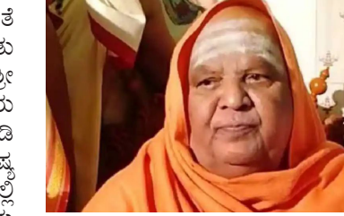
ನುಡಿದಿದ್ದಾರೆ. ಇದು ರಾಜಕೀಯಕ್ಕೆ ಸಂಬಂಧಿಸಿದ್ದು ಎಂಬುದು ಮೇಲ್ನೋಟಕ್ಕೆ ಗೊತ್ತಾಗುತ್ತಿದೆ. ರಾಷ್ಟ್ರ ಮಟ್ಟದ ಇಬ್ಬರು ನಾಯಕರ ಜೀವಕ್ಕೆ