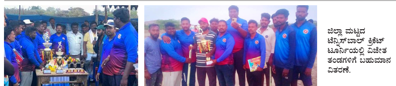
ಜಿಲ್ಲಾ ಮಟ್ಟದ ಟೆನ್ನಿಸ್ ಬಾಲ್ ಕ್ರಿಕೆಟ್ ಟೂರ್ನಿಯಲ್ಲಿ ವಿಜೇತ ತಂಡಗಳಿಗೆ ಬಹುಮಾನ ವಿತರಣೆ.