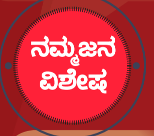
ನಮ್ಮ ಜನ ಬಿಶೇಷ