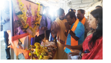
ಹೋಗುತ್ತಿರುವ ಭಕ್ತರಿಗೆ ರೈಲ್ವೆ ನಿಲ್ದಾಣದಲ್ಲಿ ಹಮ್ಮಿಕೊಂಡಿದ್ದ ಬೀಳ್ಕೊಡುಗೆ ಸಮಾರಂಭದ ಸಂದರ್ಭದಲ್ಲಿ

» ಚಿತ್ರದುರ್ಗ ಕೇಂದ್ರ ಸರ್ಕಾರ ಅಪ್ಪರ ಭದ್ರಾ ಯೋಜನೆಗೆ ಹಣವನ್ನು ನೀಡಲು ತಯಾರಿದೆ. ಆದರೆ, ರಾಜ್ಯ ಸರ್ಕಾರದಿಂದ ಇದಕ್ಕಾಗಿ ಪ್ರತ್ಯೇಕವಾಗಿ ಬ್ಯಾಂಕ್ ಖಾತೆ ತೆರೆಯಬೇಕಿದೆ. ಆದರೆ ಈ ಕೆಲಸವನ್ನು ರಾಜ್ಯ ಸರ್ಕಾರ ಮಾಡುತ್ತಿಲ್ಲ ಇದರಿಂದ ಕೇಂದ್ರ ಸರ್ಕಾರ ಹಣವನ್ನು ನೀಡುತ್ತಿಲ್ಲ ಎಂದು ಕೇಂದ್ರ ಸಾಮಾಜಿಕ ನ್ಯಾಯ ಮತ್ತು ಸಬಲೀಕರಣ ರಾಜ್ಯ ಸಚಿವ ಎ.ನಾರಾಯಣಸ್ವಾಮಿ ಕಾಂಗ್ರೆಸ್‌ಗೆ ತಿರುಗೇಟು ನೀಡಿದರು. ಚಿತ್ರದುರ್ಗದಿಂದ ಆಯೋಜನೆ