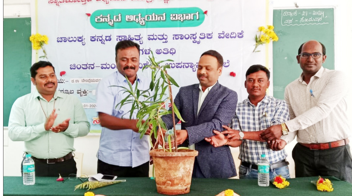
ಸಮರಸವೇ ಜೀವನ ಎಂದು ಬದುಕನ್ನು ಎದೆಗುಟ್ಟಿಕೊಂಡಾಗ ಅರಳಿದ ಕಾವ್ಯ ಚೇತನ. ಬೇಂದ್ರೆಯವರ ಕಾವ್ಯದ ವಿಶೇಷವೆಂದರೆ ಬದುಕೇ ಕಾವ್ಯವಾಗುತ್ತಾ ಮಡಿಲ ಮಗನ ಸಾವು, ಸಂಸಾರದ ಹೀಗೇ ನೋಡಬಾಡ ನನ್ನ ನಾನೊಂದು ನೆನದರೆ, ಸಖೀಗೀತ ನಾದಲೀಲೆ ಮೊದಲಾದ ಕವಿತೆಗಳಲ್ಲಿ ಅವರ ಬದುಕಿಗೆ ತೀವ್ರವಾದ ಆಘಾತವನ್ನುಂಟು ಮಾಡಿದ ಮಗನ ಸಾವು, ಸಂಸಾರದ ವಿರಸ, ತನ್ನ ಬದುಕಿನ ಕಥೆ ವ್ಯಥೆಗಳಿಂದ ಮೂಡಿದವುಗಳು. ಬದುಕಿನ ಅನನ್ಯತೆಯನ್ನು ಕಾವ್ಯವಾಗಿ ಮಾಡಿದ ಸಹಜ ಕವಿ ಎಂದು ತಿಳಿಸಿದರು. ಸುಮಾರು 27 ಕವನ ಸಂಕಲನಗಳನ್ನು