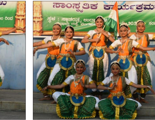
ಬೆಂಗಳೂರಿನಲ್ಲಿ ರಾಜ್ಯಮಟ್ಟದ ಗಣರಾಜ್ಯೋತ್ಸವದ ಪ್ರಯುಕ್ತ "ಪ್ರೀಡಂ ಪಾರ್ಕ್ ನಲ್ಲಿ" ಅಂಜನ ನೃತ್ಯ ಕಲಾ ಕೇಂದ್ರದ ವತಿಯಿಂದ ಕಾರ್ಯಕ್ರಮ ಯಶಸ್ವಿಯಾಗಿ ನಡೆಯಿತು.