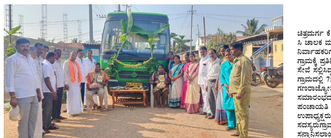
ಚಿತ್ರದುರ್ಗ ಕೆ ಎಸ್ ಆರ್ ಟಿ ಸಿ ಚಾಲಕ ಮತ್ತು ನಿರ್ವಾಹಕರಿಗೆ ಲಕ್ಷಿ ಸಾಗರ ಗ್ರಾಮಕ್ಕೆ ಪ್ರತಿನಿತ್ಯ ಉತ್ತಮ ಸೇವೆ ಸಲ್ಲಿಸಿದ್ದಕ್ಕಾಗಿ ಗ್ರಾಮದಲ್ಲಿ 75ನೇ ಗಣರಾಜ್ಯೋತ್ಸವದ ಸಮಾರಂಭದ ಗ್ರಾಮ ಪಂಚಾಯತಿ ಅಧ್ಯಕ್ಷರು ಉಪಾಧ್ಯಕ್ಷರು ಸರ್ವ ಸದಸ್ಯರುಗ್ರಾಮದ ಗ್ರಾಮಸ್ಥರು ಸನ್ಮಾನಿಸಲಾಯಿತು