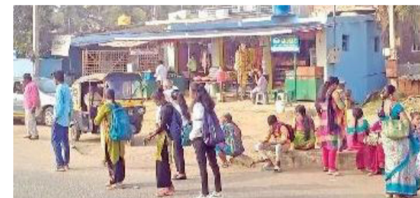
» ಹಿರಿಯರೂ ಹಿರಿಯರಿನಿಂದ ಚಿತ್ರದುರ್ಗಕ್ಕೆ ಬೆಳಿಗ್ಗೆ ಹಾಗೂ ಸಂಜೆ ವೇಳೆಯಲ್ಲಿ ನಿಗದಿತ ಸಮಯಕ್ಕೆ ಸಮರ್ಪಕ ಬಸ್ ಸೌಕರ್ಯ ಇಲ್ಲದೆ ಶಾಲೆ ಕಾಲೇಜಿನ ವಿದ್ಯಾರ್ಥಿಗಳು, ವಿವಿಧ ಕಚೇರಿಗಳಿಗೆ ತೆರಳುವ ನೌಕರರು, ಪ್ರಯಾಣಿಕರು ಪರದಾಡುವಂತಹ ಸ್ಥಿತಿ ಉಂಟಾಗಿದೆ ಎಂಬುದಾಗಿ ಸಾರ್ವಜನಿಕರು ಆಕ್ರೋಶ ವ್ಯಕ್ತಪಡಿಸಿದ್ದಾರೆ.ತಾಲ್ಲೂಕಿನಿಂದ ಜಿಲ್ಲಾ ಕೇಂದ್ರ ಚಿತ್ರದುರ್ಗಕ್ಕೆ ಪ್ರತಿನಿತ್ಯ ನೂರಾರು ವಿದ್ಯಾರ್ಥಿಗಳು, ವಿವಿಧ ಕಚೇರಿಗಳಿಗೆ ತೆರಳುವ ನೌಕರರು, ಪ್ರಯಾಣಿಕರು ಸೇರಿದಂತೆ ಸಾವಿರಾರು ಸಂಖ್ಯೆಯಲ್ಲಿ ನಾಗರಿಕರು ಸಂಚರಿಸುತ್ತಾರೆ. ಈ ಮಾರ್ಗದಲ್ಲಿ ಯಾವುದೇ ಖಾಸಗಿ ಬಸ್ ಸೌಲಭ್ಯಗಳಿಲ್ಲದ ಇರುವುದು ವಿದ್ಯಾರ್ಥಿಗಳಿಗೆ ತೊಂದರೆಯಾಗಿದೆ.ದಿನನಿತ್ಯವೂ ಶಾಲಾ ಕಾಲೇಜುಗಳಿಗೆ ಹೋಗುವ ವಿದ್ಯಾರ್ಥಿಗಳು ಬೆಳಿಗ್ಗೆಯಿಂದ ಬಸ್ ಗಾಗಿ ಕಾಯುವಂತಹ ಪರಿಸ್ಥಿತಿ ನಿರ್ಮಾಣವಾಗಿದ್ದು, ನಿಗದಿತ ಸಮಯದಲ್ಲಿ ಬಸ್ ಗಳು ಇಲ್ಲದೇ ಇದ್ದು, ಅಲ್ಲದೆ ಬೆಂಗಳೂರು ಕಡೆಯಿಂದ ಬರುವ ಕೆಲವು ಸರ್ಕಾರಿ ಬಸ್ ಗಳು ನಗರದ ಬಸ್ ನಿಲ್ದಾಣದಿಂದ ಬೈಪಾಸ್ ಮೂಲಕವೇ ಹೋಗುತ್ತವೆ.ಇದರಿಂದ ನಗರದ ಗಾಂಧಿವೃತ್ತ, ತಾಲ್ಲೂಕು ಕಚೇರಿ, ಟಿ.ಬಿ.ಸರ್ಕಲ್ ನಿಲ್ದಾಣದಲ್ಲಿ ಕಾಯುವವರು ಗಂಟೆಗಟ್ಟಲೆ ನಿಂತು ಕಾಯಬೇಕೆ, ಒಂದೆರಡು ಬಸ್ ಬಂದರೂ ಸಹ ಅಗತ್ಯಕ್ಕಿಂತ ಹೆಚ್ಚು ಪ್ರಯಾಣಿಕರಿಂದ ತುಂಬಿ ತುಳುಕುವ, ಈವೇಳೆ ನಿಲ್ದಾಣದಲ್ಲಿ ಬಸ್ ಹತ್ತಲು ವಿದ್ಯಾರ್ಥಿಗಳು ಬಸ್ ಹಿಂದೆ ಓಡುವಂತೆ ದೃಷ್ಟಿ ನಿತ್ಯ ಸಾಮಾನ್ಯವಾಗಿದೆ. ಇತ್ತೀಚೆಗೆ ನಿತ್ಯವೂ ಈ ಪರಿಸ್ಥಿತಿ ಕಂಡ ವಿದ್ಯಾರ್ಥಿಗಳು ಆಕ್ರೋಶಗೊಂಡು ಬೈಪಾಸ್ ರಸ್ತೆಗೆ ಹೋಗಿ ಕೆಎಸ್. ಆರ್.ಟಿ.ಸಿ ಬಸ್ ತಡೆಗಟ್ಟಿ ಪ್ರತಿಭಟನೆ ನಡೆಸಿದರಲ್ಲದೆ, ಸಾಕಷ್ಟು ಬಾರಿ ಸಂಬಂಧಪಟ್ಟ ಅಧಿಕಾರಿಗಳಿಗೆ ಈ ಬಗ್ಗೆ ಮನವಿ ಸಲ್ಲಿಸಿದ್ದರೂ ವಿದ್ಯಾರ್ಥಿಗಳಿಗೆ ಸಾರಿಗೆ ಸೌಕರ್ಯ ಕಲ್ಪಿಸದಿರುವುದು ವಿದ್ಯಾರ್ಥಿಗಳ ಆಕ್ರೋಶಕ್ಕೆ ಕಾರಣವಾಗಿದೆ.