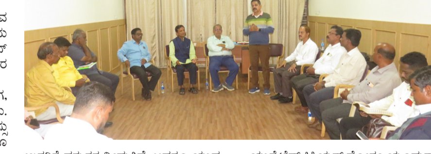
ಉಗ್ರರಿಗೆ ಪ್ರತ್ಯುತ್ತರ ನೀಡುತ್ತಿದೆ. ಆದರೂ ಯುದ್ಧ ಎಂದ ಮೇಲೆ ಏನು ಅರಿಯದ ಮುಗ್ಧರ ಜೀವ ಹರಣವಾಗುತ್ತದೆ. ಶಾಂತಿಧೂತನಾದ ಏಸು ಯುದ್ಧವನ್ನು ಅಂತ್ಯಗೊಳಿಸಿ ನಮ್ಮದಿ ನೆಲೆಸುವಂತೆ ಪ್ರೇರೇಪಿಸಲಿ ಎಂದು ಪ್ರಾರ್ಥಿಸಲಾಯಿತು.

» ಚಿತ್ರದುರ್ಗ ಇಸ್ರೇಲ್-ಹಮಾಸ್ ನಡುವೆ ನಡೆಯುತ್ತಿರುವ ಯುದ್ಧ ಕೊನೆಗೊಂಡು ಶಾಂತಿ ನೆಲೆಸಲಿ ಎಂದು ಯುನೈಟೆಡ್ ಕ್ರಿಶ್ಚಿಯನ್ ಫೋರಂ ಯೂಮನ್ ರೈಟ್ಸ್‌ನಿಂದ ಪ್ರವಾಸಿ ಮಂದಿರದಲ್ಲಿ ಸೋಮವಾರ ಪ್ರಾರ್ಥನೆ ಸಲ್ಲಿಸಲಾಯಿತು. ಯುದ್ಧದಿಂದ ಮಹಿಳೆಯರ ಮಾನಭಂಗ, ಮಟ್ಟ ಮಕ್ಕಳ ಹತ್ಯೆ ಕ್ರಮಿಸಲಾಗುವುದು. ದಯಾಮಯನಾದ ಏಸು ಅಲ್ಲಿನ ಉಗ್ರರ ಮನಸ್ಸು ಪರಿವರ್ತನೆಗೊಳಿಸಲಿ. ಪ್ರತಿಯೊಂದು ಜೀವಿಗೂ ಬದುಕುವ ಹಕ್ಕಿದೆ. ಅಮಾಯಕರು, ಮುಗ್ಧರು, ಶೋಷಣೆಗೊಳಗಾಗುತ್ತಿದ್ದಾರೆ. ವಿಶ್ವಸಂಸ್ಥೆ ಬಿಗಿ ನಿಲುವು ತಾಳಿ ಇಸ್ರೇಲ್-ಹಮಾಸ್ ಯುದ್ಧವನ್ನು ನಿಲ್ಲಿಸಬೇಕು. ಚಿಕ್ಕ ರಾಷ್ಟ್ರ ಇಸ್ರೇಲ್ ಶಕ್ತಿಶಾಲಿಯಾಗಿ ಬೆಳೆದಿರುವುದರಿಂದ ಹಮಾಸ್