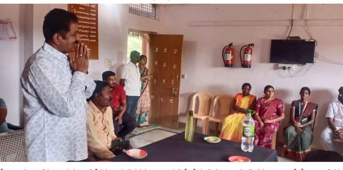
ಕೋಲಾರ, ಚಿಕ್ಕಬಳ್ಳಾಪುರ ಜಿಲ್ಲೆಗಳ ಸುಖಿಗಳನ್ನು ಅರಿತಿದ್ದೇನೆ. ಸಂದಿಸಲು ವಿಧಾನಸಭಾ ಕ್ಷೇತ್ರಗಳು ಬರಲಿವೆ. ಶಿಕ್ಷಣ ಪ್ರಾಮಾಣಿಕ ಪ್ರಯತ್ನ ಮಾಡಲಾಗುವುದು. ಸಂಸ್ಥೆ ನಡೆಸುತ್ತಾ ಬಂದಿದ್ದು, ಶಿಕ್ಷಕರ ಕಷ್ಟ ಒಂದು ಅವಕಾಶ ಕಲ್ಪಿಸಲು ಮನವಿ ಮಾಡಿದರು. ಆಗ್ನೇಯ ಶಿಕ್ಷಕರ ಈ ಬಾರಿ ಬದಲಾವಣೆ ಬಯಸಿದ್ದಾರೆ ಎಂದು ಕಾಂಗ್ರೆಸ್ ಪಕ್ಷದ