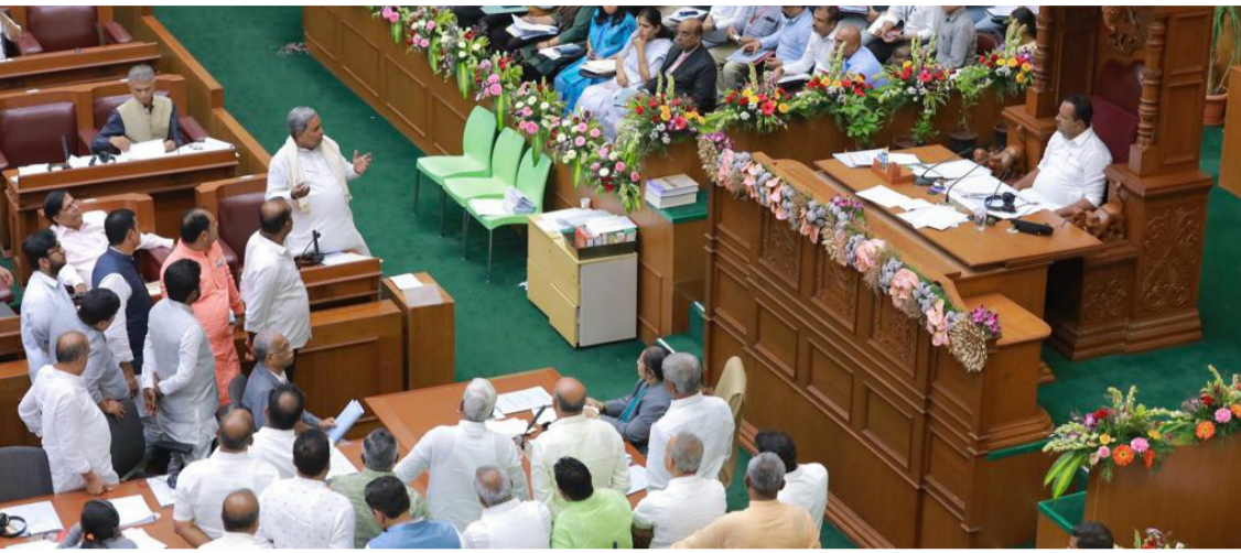
ಕೇಂದ್ರದ ವೈಫಲ್ಯ ಮುಚ್ಚಿಹಾಕಲು ಬಿಜೆಪಿ ಅಡಿ

ತಮ್ಮ ಪಕ್ಷದೊಳಗಿನ ಒಳಜಗಳ ಮತ್ತು ಬರಗಾಲ ಪರಿಹಾರಕ್ಕೆ ಹಣ ನೀಡದ ಕೇಂದ್ರ ಸರ್ಕಾರದ ವೈಫಲ್ಯವನ್ನು ಮುಚ್ಚಿಹಾಕಿ ಜನರ ಗಮನ ಬೇರೆ ಕಡೆ ಸೆಳೆಯುವ ದುರುದ್ದೇಶದಿಂದ ರಾಜ್ಯದ ಬಿಜೆಪಿ ಶಾಸಕರು ವಿಧಾನಸಭೆಯಲ್ಲಿ ಧರಣಿ ನಡೆಸಿ ಕಲಾಪಕ್ಕೆ ತಡೆಯೊಡ್ಡುತ್ತಿದ್ದಾರೆ. ಇವರಿಗೆ ರಾಜ್ಯದ ಜನರ ಬಗ್ಗೆ ಕಿಂಚಿತ್ತೂ ಕಾಳಜಿ ಇಲ್ಲ, ಜನತೆ ರಾಜಕೀಯ ಪಕ್ಷಗಳು ಮತ್ತು ರಾಜಕೀಯ ನಾಯಕರಿಗೆ ಜನತೆ ಭೀಮರಿ ಹಾಕುತ್ತಿರುವುದಕ್ಕೆ ಚುನಾಯಿತ ಪ್ರತಿನಿಧಿಗಳ ಇಂತಹ ಬೇಜವಾಬ್ದಾರಿ ನಡವಳಿಗಳೇ ಕಾರಣ.