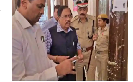
ಜೊತೆಗಿದ್ದರು. ಬಳಿಕ ಮಾಧ್ಯಮಗಳ ಜೊತೆಗೆ ಮಾತನಾಡಿದ ಡಾ. ಜಿ. ಪರಮೇಶ್ವರ್, 24 ವರ್ಷದ ಯುವಕ ಯುವತಿಯನ್ನು ಜತೆಗೆ ಕರೆದುಕೊಂಡು