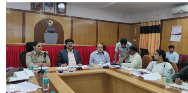
2024ರ ಲೋಕಸಭಾ ಚುನಾವಣೆಗೆ ಸಿದ್ಧತೆ ಆರಂಭ, ವಲ್ಲೆರಬಲ್, ಕ್ರಿಟಿಕಲ್ ಮತಗಟ್ಟೆಗಳ ಸಮೀಕ್ಷೆ