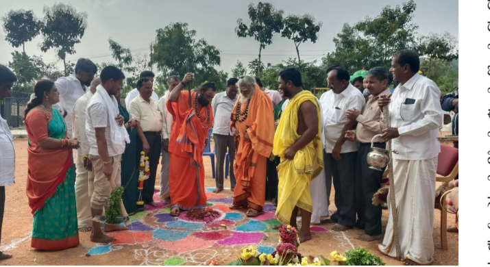
ಡೆವಲಪ್‌ಮೆಂಟ್ ಟ್ರಸ್ಟ್ ಆವರಣದಲ್ಲಿ ನಡೆದ ಎಸ್.ನಿಜಲಿಂಗಪ್ಪ ಪದವಿಪೂರ್ವ ಕಾಲೇಜು ಕಟ್ಟಡದ ಶಿಲಾನ್ಯಾಸ ನೆರವೇರಿಸಿ ಮಾತನಾಡಿದರು. ಈ ಹಿನ್ನೆಲೆಯಲ್ಲಿ ಎಸ್.ನಿಜಲಿಂಗಪ್ಪ ಎಜುಕೇಷನಲ್ ಅಂಡ್ ರೂರಲ್