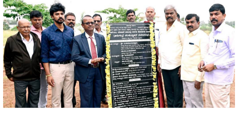
ದಿನಗಳಲ್ಲಿ ಪಿ.ಜಿ.ಕೊಡ ಆರಂಭಿಸೋಣ. ಅನುಕೂಲವಾಗಲಿ ಎಂದು ಐದು ಬಸ್‌ಗಳ ಸಂಚಾರ ಸ್ತಂತ್ರ ಖರ್ಚಿನಿಂದ ಆರಂಭಿಸಿದ್ದೇನೆ. ಏಪ್ರಿಲ್ ಒಳಗೆ ಮತ್ತೆ ಶಾಲೆ ಮಕ್ಕಳಿಗೆ ಉಚಿತ ಬಸ್‌ಗಳನ್ನು ನೀಡುತ್ತೇನೆಂದು ಭರವಸೆ ಕೊಟ್ಟರು. ಇಸ್ರೇಲ್-ಹಮಾಸ್ ಯುದ್ಧ ನಡೆಯುತ್ತಿದೆ. ಕೇವಲ 90 ಲಕ್ಷ