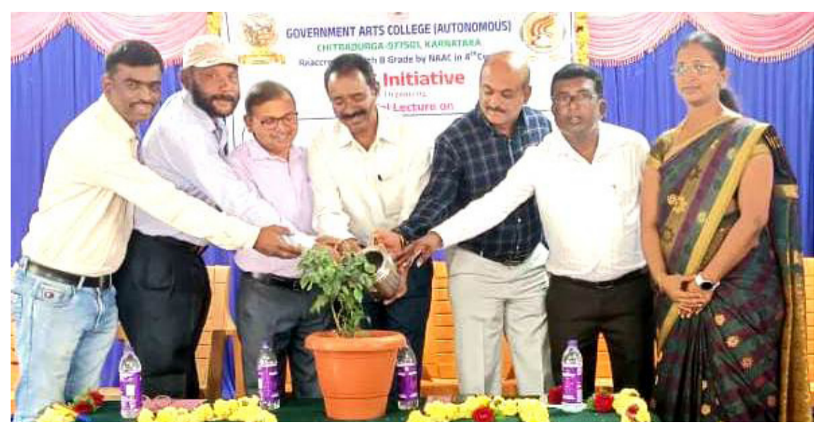
ವಿಮಲ ಅವಕಾಶ ಗಳವೆ. ವಿದ್ಯಾರ್ಥಿಗಳು ಅಭ್ಯವಿರುವ ಅವಕಾಶಗಳನ್ನು ಪರಿಪೂರ್ಣವಾಗಿ ಬಳಸಿಕೊಳ್ಳಬೇಕು. ಆದಾಯ ತೆರಿಗೆ ಇಲಾಖೆ ಹಾಗೂ ಖಾಸಗಿ ಮತ್ತು ಸರ್ಕಾರಿ ವಲಯಗಳಲ್ಲಿ ವಾಣಿಜ್ಯಶಾಸ್ತ್ರ ವಿದ್ಯಾರ್ಥಿಗಳಿಗೆ ಇರುವ