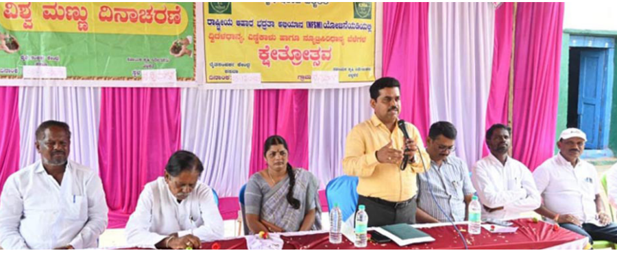
ಮಾತನಾಡಿದರು. ಕಳೆದ ಹಲವಾರು ವರ್ಷಗಳಿಂದ ಕೃಷಿ ಇಲಾಖೆ ಸಹಯೋಗದೊಂದಿಗೆ ರೈತ ಜಮೀನುಗಳ ಮಣ್ಣು ಪರೀಕ್ಷೆ ನಡೆಯುತ್ತಲೇ ಇದೆ. ಆದರೆ, ಇತ್ತೀಚಿನ ದಿನಗಳಲ್ಲಿ ಸರ್ಕಾರ ಎಲ್ಲಾ ರೈತ ಜಮೀನುಗಳ ಮಣ್ಣು ಪರೀಕ್ಷೆ ನಡೆಸಲು ಸೂಚನೆ ನೀಡಿದ್ದು, ಈಗಾಗಲೇ ತಾಲ್ಲೂಕಿನ ಸಾರಾಂ ರೈತ ಜಮೀನಿನ ಮಣ್ಣು ಪರೀಕ್ಷೆಯನ್ನು ಇಲಾಖೆ ವತಿಯಿಂದ ಮಾಡಲಾಗಿದೆ ಎಂದರು. ಕಾರ್ಯಕ್ರಮದ ಅಧ್ಯಕ್ಷತೆಯನ್ನು ಗ್ರಾಮ ಪಂಚಾಯತಿ ಅಧ್ಯಕ್ಷ