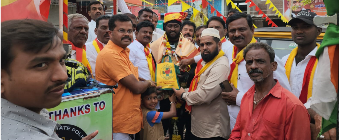
ಹೊಂದಿದ್ದಾರೆ ಎಂದರು.ತಮಿಳುನಾಡು ಮೂಲದ ಅಭಿಮಾನಿಯೊಬ್ಬ 34 ರಾಜ್ಯಗಳ 733 ಜಿಲ್ಲೆಗಳಲ್ಲಿ ವಿಶ್ವಶಾಂತಿಗಾಗಿ ಪ್ರವಾಸ ಮಾಡಲು ಹೊರಟಿರುವುದು, ಭಾಷೆಗೂ ಮೀರಿದ ಅಭಿಮಾನವಾಗಿದೆ. ಪುನೀತ್ ರಾಜಕುಮಾರ್ ದತ್ತು ಪಡೆದಿರುವ ಶಾಲೆಗಳು, ಅನಾಥಾಶ್ರಮಗಳು, ಅವರ ಸಮಾಜಮುಖಿ ಸೇವೆಗಳು ನನಗೆ ಜೀವನದಲ್ಲಿ ಸಮಾಜ ಸೇವೆ ಮಾಡಲು ಪ್ರೇರಣೆಯಾಗಿವೆ. ಇಂತಹ ಅಭಿಮಾನಿಗಳನ್ನು ಪಡೆದ ಪುನೀತ್ ರಾಜಕುಮಾರ್ ಅವರು ನಿಜವಾಗಿಯೂ