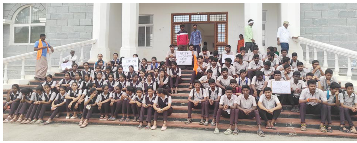
ತಹಶೀಲ್ದಾರ್ ಮನವಿ ನೀಡಿ ಮಾತನಾಡಿದ ಅವರು, ಅರೆಕಾಲಿಕ ಉಪನ್ಯಾಸಕರು ತಮ್ಮ ಕೆಲಸಕ್ಕೆ ಬರಲು ಸರ್ಕಾರದ ಮಧ್ಯಪ್ರವೇಶಕ್ಕೆ ಎಚ್ಚರಿಕೆ ಒತ್ತಾಯ ಮಾಡಿದರು.