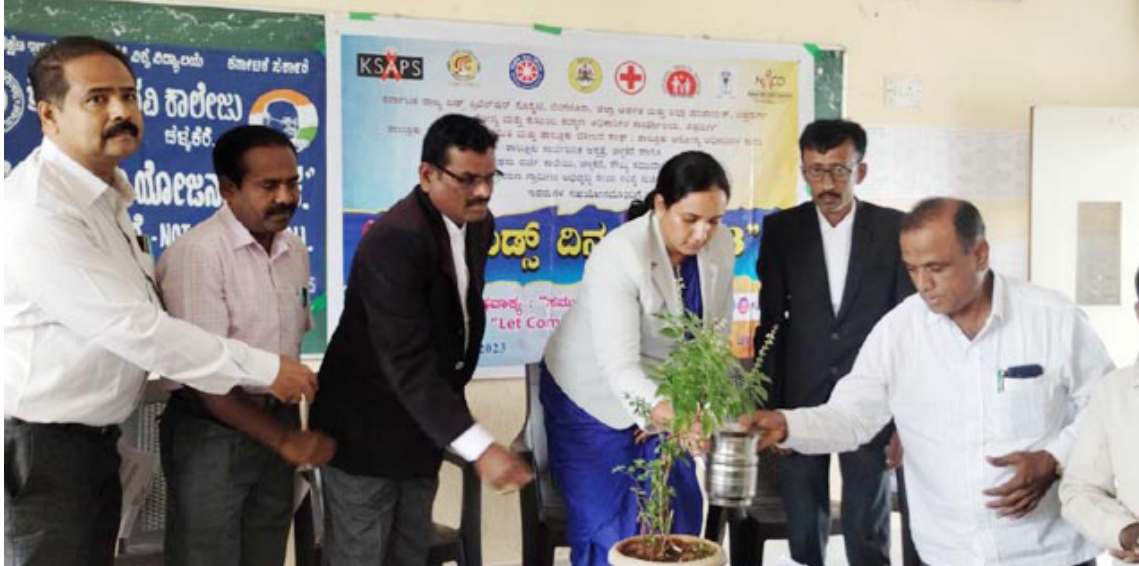
ನಮ್ಮನ್ನು ವ್ಯಾಪಿಸುತ್ತದೆ. ಈ ರೋಗ ಚಿಕಿತ್ಸೆ ಪಡೆದರೆ ಗುಣಮುಖರಾಗಬಹುದು. ಸಮಾಜದ ಪ್ರತಿಯೊಬ್ಬ ವ್ಯಕ್ತಿಯೂ ಭಯಾನಕವಾದರೂ ಸೂಕ್ತ ಕಾಲದಲ್ಲಿ ಆದರೆ, ಪ್ರತಿಯೊಬ್ಬ ವಿದ್ಯಾರ್ಥಿ ಹಾಗೂ ಇಂತಹ ಮಾರಕ ರೋಗದಿಂದ