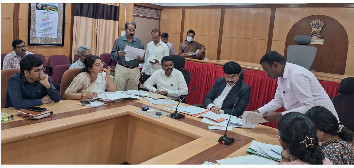
ತುಮಕೂರು-ದಾವಣಗೆರೆ ನೇರ ರೈಲು ಮಾರ್ಗವು ದಾವಣಗೆರೆ ತಾಲ್ಲೂಕಿನ ತೋಳುಹೂಣಿ, ಬುಳ್ಳಾಪುರ, ಆನಗೋಡು, ನೀರ್ಥಡಿ, ಹೆಬ್ಬಾಳ, ಹುಣಸೇಕಟ್ಟೆ, ಪಂಚೇನಹಳ್ಳಿ, ಚಿಕ್ಕವನಹಳ್ಳಿ, ಕೆಲಕ್ಕೇನಹಳ್ಳಿ, ಕೊಗ್ಗನೂರು, ಹಾಲುವರ್ತಿ ಗ್ರಾಮಗಳ ಮೂಲಕ ರೈಲು ಮಾರ್ಗ ಹಾದು ಹೋಗಲಿದ್ದು, ರಂಗವನಹಳ್ಳಿ ಹಾಗೂ ಚಿಟೋಬನಹಳ್ಳಿಯಲ್ಲಿ ಬಾಕಿ ಇರುವ