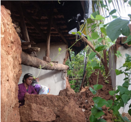
ಮುಖ್ಯವಾಗಿ ರೈತಾಪಿ ವರ್ಗಕ್ಕೆ ಮಳೆ ಇಲ್ಲದೆ ಹಾಕಿದ್ದ

» ನಾರತಿಹಳ್ಳಿಮಂಜುನಾಥ್ ಹೊಸದುರ್ಗ: ಕಳೆದ ಸುಮಾರು 6 ರಿಂದ 7 ತಿಂಗಳು ಕಳೆದರೂ ಮಳೆ ಇಲ್ಲದೆ ಕಂಗಾಲಾಗಿದ್ದ ತಾಲೂಕಿನ ಜನತೆ ಮುಖವಾಗಿ ಕೃಷಿಕರಿಗೆ ಕಳೆದ ಎರಡು ಮೂರು ದಿನಗಳಿಂದ ಸಂವೃದ್ಧಿಯಾಗಿ ಬಂದ ಮಳೆಗೆ ಸಂತಸಗೊಂಡಿದ್ದಾರೆ.ತಾಲೂಕಿನಾಧ್ಯಂತ ಸಾಕಷ್ಟು ಮಂದಿ ರೈತರು ಮಳೆಯ ನಿರೀಕ್ಷೆ ಇಟ್ಟುಕೊಂಡು ಅಡಿಕೆ ಮತ್ತು ತೆಂಗು ಹಾಕಿದ್ದರು.ಮಳೆ ಇಲ್ಲ ಎಂಬ ಆತಂಕದಿಂದ ದಿನದೂಡುತ್ತಿದ್ದರು ಆದರೆ ಈಗ ಬಂದಿರುವ ಮಳೆಗೆ ಹಾಗೂ ಮುಂದೆ ಮಳೆ ಬರಬಹುದು ಎಂಬ ನಿರೀಕ್ಷೆ ಇಟ್ಟುಕೊಂಡಿದ್ದ ಅಡಿಕೆ ತೆಂಗು ಹಾಕಿರುವ ರೈತರಿಗೆ ಈಗ ಬರುತ್ತಿರುವ ಮಳೆಗೆ ಬಾಯಿಗೆ ಲಡ್ಡು ಬಿದ್ದಂತಾಗಿದೆ. ಮುಖ್ಯವಾಗಿ ರೈತಾಪಿ ವರ್ಗಕ್ಕೆ ಮಳೆ ಇಲ್ಲದೆ ಹಾಕಿದ್ದ