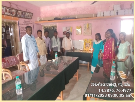
ನೆಲಗೇತನಹಟ್ಟಿ ಗ್ರಾ.ಪಂ.ನಲ್ಲಿ ಕನ್ನಡ ರಾಜ್ಯೋತ್ಸವ ಆಚರಣೆ