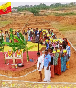
ಚಳ್ಳಕೆರೆ ತಾಲ್ಲೂಕಿನ ಜಾದೂರು ಗ್ರಾಮ ಪಂಚಾಯಿತಿ ವ್ಯಾಪ್ತಿಯ ಕಾಮಸಮುದ್ರ ಗ್ರಾಮದಲ್ಲಿ ನರೇಗಾ ಕೂಲಿಕಾರ್ಮಿಕರು 68ನೇ ಕನ್ನಡ ರಾಜ್ಯೋತ್ಸವ ಹಿನ್ನೆಲೆಯಲ್ಲಿ ಭೂಮಿಯಲ್ಲಿ ಕರ್ನಾಟಕ ಭೂಪಟವನ್ನು ರಚಿಸಿ ಕನ್ನಡ ರಾಜ್ಯೋತ್ಸವ ಆಚರಣೆ ಮಾಡಿದರು.