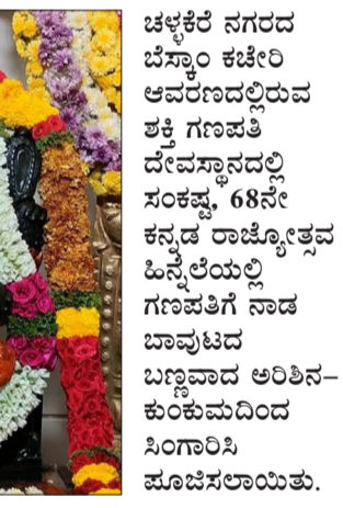
ಚಳ್ಳಕೆರೆ ನಗರದ ಬೆಸ್ತಾಂ ಕಚೇರಿ ಆವರಣದಲ್ಲಿರುವ ಶಕ್ತಿ ಗಣಪತಿ ದೇವಸ್ಥಾನದಲ್ಲಿ ಕನ್ನಡ ರಾಜ್ಯೋತ್ಸವ ಹಿನ್ನೆಲೆಯಲ್ಲಿ ಗಣಪತಿಗೆ ನಾಡ ಬಾಳುವುದಿ ಬಗ್ಗುವುದಿ ಅರಿಶಿನ-ಕುಂಕುಮದಿಂದ ಸಿಂಗಾರಿಸಿ ಪೂಜಿಸಲಾಯಿತು.