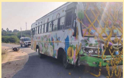
» ಚಳ್ಳಕೆರೆ ತಾಲ್ಲೂಕಿನ ಗೋಪನಹಳ್ಳಿ ಕ್ರಾಸ್‌ನ ಯಾದವ