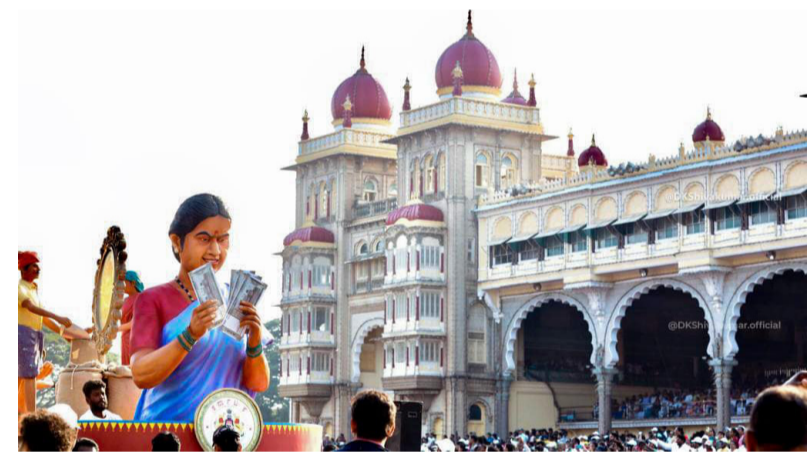
ನಿಯೋಜನೆ ಮಾಡಲಾಗಿದೆ. ಆಯುಕ್ತದಲ್ಲಿ ನಡವಳಿಕೆಯುಳ್ಳವರ ಮೇಲೆ ತೀವ್ರ ನಿಗಾ ಹಾಗೂ ಸೂಕ್ತ ಸ್ಥಳಗಳಲ್ಲಿ ಭದ್ರತೆಯನ್ನು ಹೆಚ್ಚಿಸಲಾಗಿದೆ. ಹೀಗಾಗಿ ಅನುಮಾನಾಸ್ಪದ ವಹಿಸಲಾಗಿದೆ.