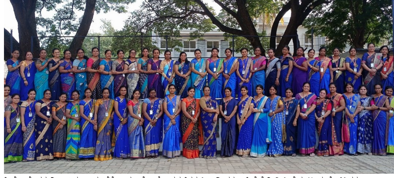
ಶ್ರೀಸೋಮೇಶ್ವರ ವಿದ್ಯಾಲಯ ದಾವಣಗೆರೆ ಹಾಗೂ ಗೋಣಿಪಾಡದ ಶಿಕ್ಷಕ ಸಿಬ್ಬಂದಿ ದಸರಾ ಹಿನ್ನೆಲೆ ನೀರಿ ಸೀರೆಯುಟ್ಟು ಕಂಗೊಳಿಸಿದರು.