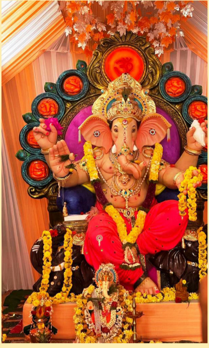
ದಾವಣಗೆರೆ 7-10-2023 ರಂದು ಪ್ರಮುಖ ರಾಜ ಬೀದಿಗಳಲ್ಲಿ ಬೃಹತ್ ಶೋಭಾ ಯಾತ್ರೆ ಮುಖಾಂತರ ಸ್ವಾಮಿಯ ಮೂರ್ತಿಯ ವಿಸರ್ಜನೆಯನ್ನು ಮಾಡಲಾಗುವುದು.