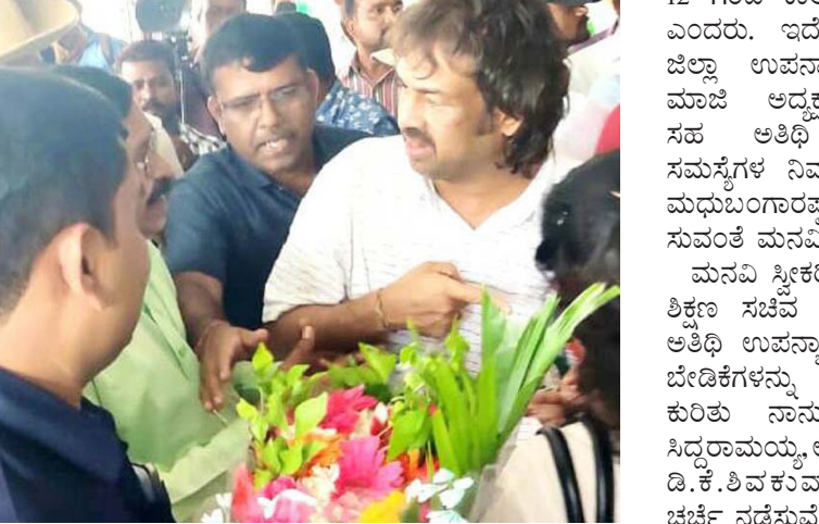
ಸರ್ಕಾರಿ ಜೂನ್ ತಿಂಗಳಿಂದಲೇ ನೀಡಿದ್ದರೂ ಗೌರವ ಧನವನ್ನು ಅತಿಥಿ ಉಪನ್ಯಾಸಕರಿಗೆ ಕಡಿತಗೊಳಿಸಲಾಗಿದೆ ಎಂಬುದಕ್ಕೆ 10 ಗಂಟೆ ಇದ್ದ ಸಮಯವನ್ನು ಕಾರ್ಯನಿರ್ವಹಿಸುವ ಜವಾಬ್ದಾರಿ