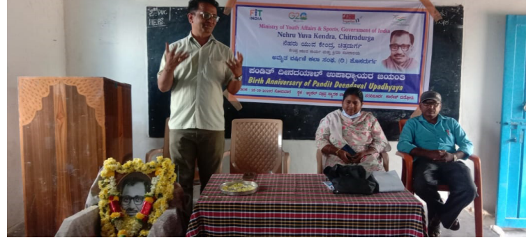
ಸಂಯುಕ್ತ ಆಶ್ರಯದಲ್ಲಿ ಏರ್ಪಡಿಸಿದ್ದ ಪಂಡಿತ ದೀನದಯಾಳ್ ಉಪಾಧ್ಯಾಯರ ಜನ್ಮದಿನ ಕಾರ್ಯಕ್ರಮದಲ್ಲಿ ಭಾಗವಹಿಸಿ ಮಾತನಾಡಿದರು. ಪಂಡಿತ ದೀನದಯಾಳ್ ಕಾಗ್ನಿಸಿಗೆ ಉಪಾಧ್ಯಾಯರು