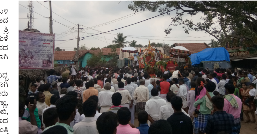
ಭಾಗಗಳಿಂದ ಆಗಮಿಸಿದ್ದ ಸಾವಿರಾರು ಭಕ್ತರು ತಾವು ಹರಕೆಯ ರೂಪದಲ್ಲಿ ತಂದಿದ್ದ ಚಿಲ್ಲರೆ ಹಣವನ್ನು ದೇವರ ಮೇಲೆ ಎರಚುವ ಮೂಲಕ ಹರಕೆ ತೀರಿಸಿದರು. ದೇವರ ಮೇಲಿಂದ ಬಿದ್ದ ಚಿಲ್ಲರೆ ಹಾಯುವ ಮೂಲಕ ಶ್ರೀ ದತ್ತರಥ ರಾಮೇಶ್ವರಸ್ವಾಮಿ ಬೆಟ್ಟಕ್ಕೆ ಕೊಂಡೊಯ್ಯಲಾಯಿತು. ಈ ಅಂಬಿನೋತ್ಸವದಲ್ಲಿ ರಾಜ್ಯದ ನಾನಾ ಭಾಗಗಳಿಂದ ಆಗಮಿಸಿದ್ದ ಸಾವಿರಾರು ಭಕ್ತರು ತಾವು ಹರಕೆಯ ರೂಪದಲ್ಲಿ ತಂದಿದ್ದ ಚಿಲ್ಲರೆ ಹಣವನ್ನು ದೇವರ ಮೇಲೆ ಎರಚುವ ಮೂಲಕ ಹರಕೆ ತೀರಿಸಿದರು. ದೇವರ ಮೇಲಿಂದ ಬಿದ್ದ ಚಿಲ್ಲರೆ ಹಾಯುವ ಮೂಲಕ ಶ್ರೀ ದತ್ತರಥ ರಾಮೇಶ್ವರಸ್ವಾಮಿ ಬೆಟ್ಟಕ್ಕೆ ಕೊಂಡೊಯ್ಯಲಾಯಿತು. ದೇವರ ಉತ್ಸವ ಮೂರ್ತಿಯನ್ನು ಕಂಚೀಪುರ.

» ಹೊಸದರ್ಗೆ ತಾಲೂಕಿನ ಮತ್ತೊಂದು ಹೋಬಳಿ ಕಂಚೀಪುರ ಗ್ರಾಮದಲ್ಲಿನ ಕಾಂಚಾರದ ದೇವರು ಎಂದು ಪ್ರಖ್ಯಾತಿ ಹೊಂದಿರುವ ಶ್ರೀ ಕಂಚೀವರದರಾಜಸ್ವಾಮಿಯವರ ಉತ್ತರ ಮಳೆ ಅಂಬಿನೋತ್ಸವದ ಅಂಗವಾಗಿ ಬುತ್ತಿ ಬಾನದ ಮೆರವಣಿಗೆ ಅತ್ಯಂತ ಅದ್ದೂರಿಯಾಗಿ ಜರುಗಿತು.