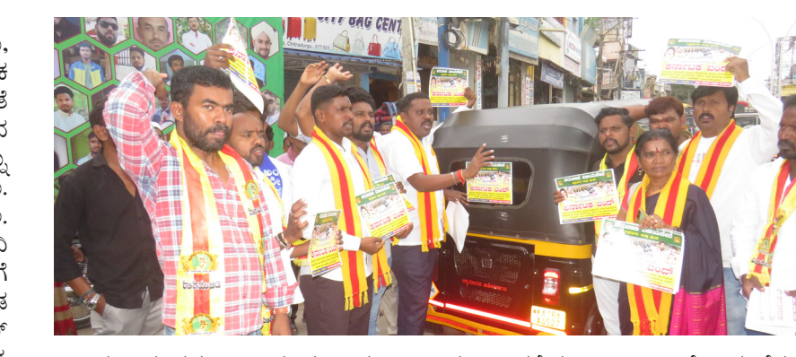
ಇಲ್ಲದಿರುವಾಗ ನಮ್ಮ ರಾಜ್ಯದ ಮುಖ್ಯಮಂತ್ರಿ ಮುಂಜಾಗತೆಯಾಗಿ ತಾಲಾ-ಕಾಲೇಜಿಗಳಿಗೆ ರಜೆ ತಮಿಳು ನಾಡಿಗೆ ನೀರು ಹರಿಸುತ್ತಿರುವುದು ಯಾವ ನ್ಯಾಯ? ಹಾಗಾಗಿ ಸಮಸ್ಯೆ ಕರ್ನಾಟಕ ಬಂದ್‌ಗೆ ಬೆಂಬಲಿಸುವಂತೆ ವಿನಂತಿಸಿದರಲ್ಲದೆ ಮುಂಜಾಗತೆಯಾಗಿ ತಾಲಾ-ಕಾಲೇಜಿಗಳಿಗೆ ರಜೆ ಘೋಷಿಸಬೇಕು. ಇಲ್ಲವಾದಲ್ಲಿ ಮುಂದೆ ಆಗಬಹುದಾದ ಅನಾಹುತಗಳಿಗೆ ನಾವು ಜವಾಬ್ದಾರರಲ್ಲ ಎಂದು ಜಿಲ್ಲಾಧಿಕಾರಿಗಳನ್ನು ಕೋರಿದರು.