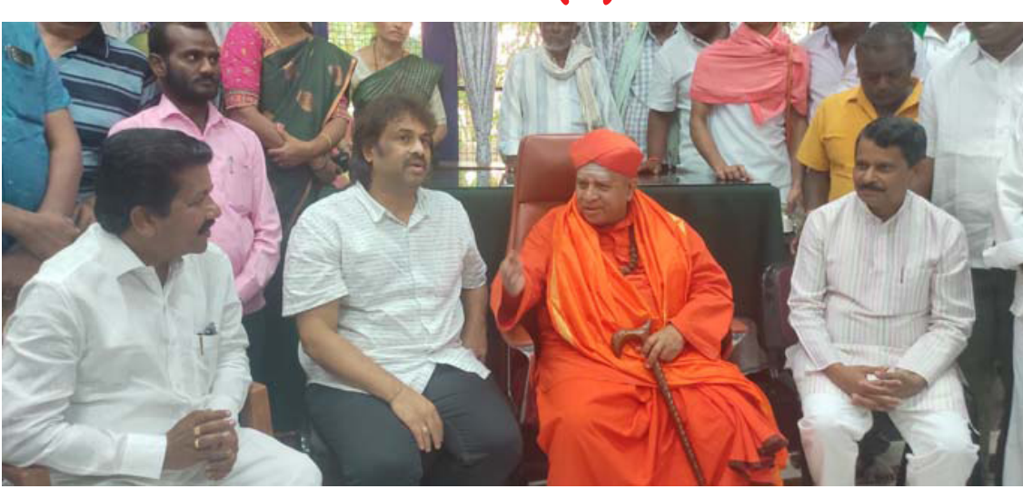
ಶೇಖರಿಸಿದ್ದಾರೆ. ಅವರು ಮಾಡಿದ ಮಾಹಿತಿ ನೀಡಿದ್ದಾರೆ. ರಾಜ್ಯದ ಬೇರೆ ಸಹ ಇಂತಹ ದೃಶ್ಯವನ್ನು ಕಾಣಲು ಸಾಧನೆಯ ಬಗ್ಗೆಯೂ ಸಹ ಸಂಪೂರ್ಣ ಯಾವುದೇ ವಿಧಾನಸಭಾ ಕ್ಷೇತ್ರದಲ್ಲೂ ಸಾಧ್ಯವಿಲ್ಲ. ಪ್ರತಿಯೊಬ್ಬ ವ್ಯಕ್ತಿಯೂ