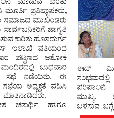
ಈಡ್ ಮಿಲಾಡ್ ಹಬ್ಬದ ಸಂದರ್ಭದಲ್ಲಿ ಎಲ್ಲರೂ ತಾಂತಿ ಪರಿಪಾಲನೆ ಮಾಡುವುದು ಮುಖ್ಯ. ಹಬ್ಬದಲ್ಲಿ ಡಿವೈಎಸ್ಸಿ ಬಳಸುವ ಬಗ್ಗೆ ಸುಸ್ತೀಕೋರ್ಸ್ ನೀಡಿರುತ್ತಾ ಆದೇಶವನ್ನು ಎಲ್ಲರೂ ಪರಿಪಾಲನೆ ಮಾಡಬೇಕು. ರಾತ್ರಿ 10ಗಂಟೆಯಿಂದ ಬೆಳಿಗ್ಗೆ 6ರ ವರೆಗೂ ಯಾರೂ ದ್ವನಿವರ್ಧಕ ಬಳಸಬಾರದು. ಡಿವೈ ಬಳಕೆಗೆ