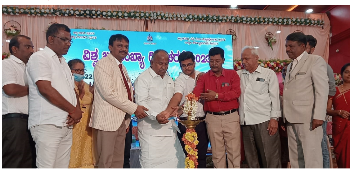
ಪ್ರಸ್ತುತ ವಸತಿ ಸೌಲಭ್ಯ, ಸಾರಿಗೆ, ಉತ್ತಮ ಶಿಕ್ಷಣ, ಉತ್ತಮ ಆರೋಗ್ಯ ಸೇವೆಗಳ ಹಲವು ಸೌಲಭ್ಯಗಳನ್ನು ಒದಗಿಸಿ, ದೇಶವು ಅಭಿವೃದ್ಧಿ ಪಥದಲ್ಲಿ ಸಾಗುತ್ತಿದೆ ಎಂದು. ಜನರಿಗೆ ಆರೋಗ್ಯ ಕಾಳಜಿ ಬಗ್ಗೆ ಹಲವು ಕಾರ್ಯಕ್ರಮ ರೂಪಿಸಿ, ಜಾಗೃತಿ ನೀಡಲು ಸರ್ಕಾರ ಹಣ ವಿನಿಯೋಗಿಸಿದೆ. ಆರೋಗ್ಯ ಇಲಾಖೆಯವರು ಸರ್ಕಾರದ ಕಾರ್ಯಕ್ರಮಗಳನ್ನು ಸದುಪಯೋಗ ಪಡೆದುಕೊಳ್ಳಬೇಕು. ಸಿಬ್ಬಂದಿಗಳು ಕರ್ತವ್ಯದಲ್ಲಿ ಬದ್ಧರಾಗಿರುವುದರಿಂದ ರಾಜ್ಯದ ಆರೋಗ್ಯ ಸಂಪತ್ತು ಸದೃಢವಾಗಿದೆ. ಆರೋಗ್ಯ