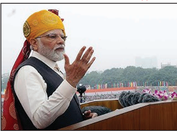
ಲೋಕಸಭಾ ಚುನಾವಣೆಯಲ್ಲಿ ನಾವು ಮತ್ತೆ ಅಧಿಕಾರಕ್ಕೆ ಬರುವುದು ನಿಶ್ಚಿತ ಎಂದರು.

ನವದೆಹಲಿ : ಪ್ರಧಾನಿ ನರೇಂದ್ರಮೋದಿ ಅವರು ದೆಹಲಿಯ ಕೆಂಪುಕೋಟೆಯಲ್ಲಿಂದು ರಾಷ್ಟ್ರಧ್ವಜಾರೋಹಣ ನೆರವೇರಿಸಿ ಮಾಡಿದ ಸ್ವಾತಂತ್ರ್ಯ ದಿನದ ಭಾಷಣದಲ್ಲಿ ಮುಂದಿನ ಲೋಕಸಭಾ ಚುನಾವಣೆಯ ಹೋರಾಟದ ಬಗ್ಗೆಯೂ ಪ್ರಸ್ತಾಪಿಸಿ 2024ರ ಲೋಕಸಭಾ ಚುನಾವಣೆ ಭ್ರಷ್ಟಾಚಾರ, ಸ್ವಜನ ಪಕ್ಷಪಾತ ಶುಷ್ಕೀಕರಣದ ವಿರುದ್ಧ ಹೋರಾಟವಾಗಲಿದೆ ಎಂದು ಬಣ್ಣಿಸಿ ಪರಿವಾರವಾದಿಗಳ ಪಕ್ಷಗಳನ್ನು ಹಿಂದಕ್ಕೆ ಬಿಜೆಪಿ ಮತ್ತೆ ಮರಳಿ ಅಧಿಕಾರದ ಗದ್ದುಗೆ ಏರಲಿದೆ ಎಂದರು. ರಾಜಸ್ಥಾನ ಶೈಲಿಯ ಬಹುಮರ್ಣದ ರುಮಾಲು ಧರಿಸಿ ದೆಹಲಿಯ ಐತಿಹಾಸಿಕ ಕೆಂಪುಕೋಟೆಯ ಮೇಲೆ ಸತತ 10 ನೇ ಬಾರಿ 77ನೇ ಸ್ವಾತಂತ್ರ್ಯೋತ್ಸವ ಪ್ರಯುಕ್ತ ಧ್ವಜಾರೋಹಣ ನೆರವೇರಿಸಿ, ಗೌರವ ಪಂದನೆ ಸ್ವೀಕರಿಸಿ ಮಾತನಾಡಿದ ಅವರು, ದೇಶದ ಜನರ ಅಶೀರ್ವಾದ ಇದ್ದರೆ ಲೋಕಸಭಾ ಚುನಾವಣೆಯಲ್ಲಿ ಗೆದ್ದು ನಾವೇ ಮರಳಿ ಅಧಿಕಾರ ಹಿಡಿಯುತ್ತೇವೆ ಎಂದು ಹೇಳುವ ಮೂಲಕ ಪ್ರಧಾನಿ ಮೋದಿ ಚುನಾವಣೆಯಲ್ಲಿ ಬಿಜೆಪಿ ಜಯಭೇರಿ ಬಾರಿಸಲಿದೆ ಎಂಬ ವಿಶ್ವಾಸವನ್ನು ವ್ಯಕ್ತಪಡಿಸಿದರು.