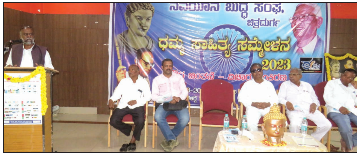
ನವಯಾನ ಬುದ್ಧ ಸಂಘದಿಂದ ಏರ್ಪಡಿಸಲಾಗಿದ್ದ ಧಮ್ಮ ಸಾಹಿತ್ಯ ಸಮ್ಮೇಳನ ಉದ್ಘಾಟಿಸಿ ಮಾಜಿ ಸಚಿವ ಹೆಚ್.ಆಂಜನೇಯ ಮಾತನಾಡಿದರು.

ಮುಂದಿನ ಚುನಾವಣೆಯಲ್ಲಿ ಬಿಜೆಪಿ ಅಡ್ಡೆಸ್ ಇರಲಿಲ್ಲ ಮಾತೆತ್ತಿದ್ದ ಮೋದಿ ಮೋದಿ ಅಂತೇಳಿ ಪ್ರಚಾರ ಮಾಡುತ್ತಿದ್ದರು. ಕರ್ನಾಟಕ ಜನರು ಬುದ್ಧಿವಂತರು, ಅದಲ್ಲೂ ವರ್ಕೌಟ್ ಆಗಿಲ್ಲ. ಮುಂದಿನ ಚುನಾವಣೆಯಲ್ಲಿ ಬಿಜೆಪಿ ಅಡ್ಡೆಸ್ ಇರಲಿಲ್ಲ. ಗ್ಯಾರಂಟಿ ಜಾರಿ ಮಾಡದಿದ್ದರೆ ಹೋರಾಟ ಮಾಡುವುದಾಗಿ ಹೇಳಿದ್ದರು. ಈಗ ಮಾತಾಡಲು ಏನೂ ಇಲ್ಲ, ಸುಮ್ಮನೆ ಆರೋಪ ಮಾಡಿದ್ದಾರೆ ಎಂದು ಕನ್ನಡ ಮತ್ತು ಸಂಸ್ಕೃತಿ ಇಲಾಖೆ ಸಚಿವ ಶಿವರಾಜ್ ತಂಗಡಿ ಹೇಳಿದರು.