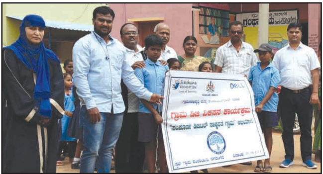
ಚಳ್ಳಕೆರೆ ತಾಲ್ಲೂಕಿನ ನಗರಂಗರೆ ಗ್ರಾಪಂ ಸಂಪೂರ್ಣ ಡಿಜಿಟಲ್ ಸಾಕ್ಷರತೆ ಕಾರ್ಯಕ್ರಮದ ಬಗ್ಗೆ ಜಾಗೃತಿ ಜಾಫ ನಡೆಸಿದರು.