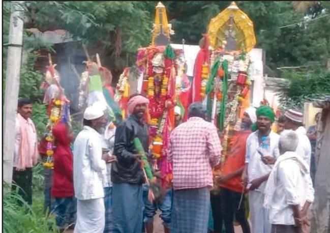
ಚಳ್ಳಕೆರೆ ತಾಲ್ಲೂಕಿನ ಕಾಲುವೆಹಳ್ಳಿ ಗ್ರಾಮದಲ್ಲಿ ಮಂಗಳವಾರ ಮೊಹರಂ ಹಬ್ಬವನ್ನು ಸಡಗರ, ಸಂಭ್ರಮದಿಂದ ಆಚರಿಸಿದರು.

ಚಳ್ಳಕೆರೆ : ತಾಲ್ಲೂಕಿನ ಕಾಲುವೆಹಳ್ಳಿ ಗ್ರಾಮದಲ್ಲಿ ಪ್ರತಿವರ್ಷದಂತೆ ಈ ವರ್ಷವೂ ಅಲ್ಲಿನ ಹಿಂದೂ ಮುಸ್ಲಿಂ ಬಂಧುಗಳು ಮೊಹರಂ ಹಬ್ಬವನ್ನು ಸಂಭ್ರಮದಿಂದ ಆಚರಿಸಿದರು. ಗ್ರಾಮದ ವಿವಿಧ ಪಕ್ಷದ ಅನೇಕ ಮುಖಂಡರೂ ಸಹ ಮೆರವಣಿಗೆಯಲ್ಲಿ ಪಾಲ್ಗೊಂಡು ಮೊಹರಂ ಹಬ್ಬಕ್ಕೆ ಶುಭಹಾರೈಸಿದರು.