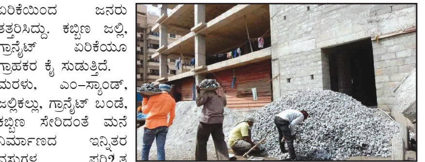
ಸಾಮಾನ್ಯರಿಗೆ ಇದರ ಬಿಸಿ ತಟ್ಟಲಿದೆ. ಇದರಿಂದ ಮನೆ ಕಟ್ಟುವ ಕಬ್ಬಿಣ, ಅದಿರು, ಜಿಲ್ಲೆ ಕಲ್ಲು, ಗ್ರಾನೈಟ್, ಮರಳು, ಎಂ. ಸ್ಯಾಂಡ್ ಸೇರಿದಂತೆ ಇನ್ನಿತರ ವಸ್ತುಗಳ ಬೆಲೆ ಇಂದಿನಿಂದ ದುಬಾರಿಯಾಗಲಿದೆ.

ಬೆಂಗಳೂರು : ಅಗತ್ಯ ವಸ್ತುಗಳ ಬೆಲೆಯಿಂದ ನಲುಗಿರುವ ಜನರಿಗೆ ಇದೀಗ ಗೃಹ ಹಾಗೂ ಇತರೆ ಕಟ್ಟಡ ನಿರ್ಮಾಣಕ್ಕೆ ಅಗತ್ಯವಿರುವ ಕಚ್ಚಾವಸ್ತುಗಳ ಬೆಲೆ ಏರಿಕೆಯಾಗುತ್ತಿರುವುದು ಗ್ರಾಹಕ ಜೇಬಿಗೆ ಕತ್ತರಿಯಾಗಿದೆ. ಇಂದಿನಿಂದ ಮರಳು, ಜಿಲ್ಲೆ, ಗ್ರಾನೈಟ್ ಕಬ್ಬಿಣ ಬೆಲೆ ಮತ್ತಷ್ಟು ದುಬಾರಿಯಾಗಿದೆ. ಇದರೊಂದಿಗೆ ಹೊಸ ಮನೆ ಕಟ್ಟಬೇಕೆಂಬ ಕನಸು ಕಾಣುತ್ತಿದ್ದವರಿಗೆ ದರ ಏರಿಕೆ ಹೊಡೆತ ಬಿದ್ದಿದೆ. ಬೆಲೆ ಏರಿಕೆಯಿಂದ ಮನೆ ಕಟ್ಟುವರು ಕಂಗಾಲಾಗಿದ್ದಾರೆ. ದಿನಸಿ, ಹಾಲು-ತರಕಾರಿ ಸೇರಿದಂತೆ ದಿನ ಬಳಕೆ ವಸ್ತುಗಳ ಬೆಲೆ ಏರಿಕೆಯಿಂದ ಜನರು ತತ್ತರಿಸಿದ್ದು. ಕಬ್ಬಿಣ ಜಿಲ್ಲೆ, ಗ್ರಾನೈಟ್ ಏರಿಕೆಯೂ ಗ್ರಾಹಕರ ಕೈ ಸುಡುತ್ತಿದೆ. ಮರಳು, ಎಂ-ಸ್ಯಾಂಡ್, ಜಿಲ್ಲೆಕಲ್ಲು, ಗ್ರಾನೈಟ್ ಬಂಡೆ, ಕಬ್ಬಿಣ ಸೇರಿದಂತೆ ಮನೆ ನಿರ್ಮಾಣದ ಇನ್ನಿತರ ವಸ್ತುಗಳ ಇಂದಿನಿಂದ ದರ ಜಾರಿಗೆ ಬಂದಿದೆ.ಕಳೆದ ಸರ್ಕಾರ ಈ ವರ್ಗ ಶೇ 10 ರಷ್ಟಿ ರಾಜಧನ ಏರಿಕೆ ಮಾಡಿತ್ತು. ಹೊಸ ಸರ್ಕಾರ ಕೂಡಾ ಮೊದಲ ಬಜೆಟ್ ನಲ್ಲಿ ರಾಜಸ್ವ ಏರಿಕೆ ಮಾಡಿದ್ದು, ನೇರವಾಗಿ ಜನ