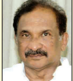
ಬೆಂಗಳೂರು : 'ಗೃಹಜ್ಯೋತಿ' ಯೋಜನೆ ಯಡಿ ಅರ್ಜಿ ಸಲ್ಲಿಸಿದ ಎಲ್ಲರಿಗೂ ಉಚಿತ ವಿದ್ಯುತ್ ನೀಡಲಾಗುತ್ತದೆ. ಆದರೆ 200 ಯುನಿಟ್ ಗಿಂತ ಹೆಚ್ಚು ವಿದ್ಯುತ್ ಬಳಸಿದರೆ ಅರ್ಜಿ ರಿಜೆಕ್ಟ್ ಆಗುತ್ತದೆ ಎಂದು ಇಂಧನ ಸಚಿವ ಕೆ.ಜೆ ಜಾರ್ಜ್ ಸ್ಪಷ್ಟನೆ ನೀಡಿದ್ದಾರೆ.

ಮಕ್ಕಳು ಒಳಗೆ ಎಂದಿರುವ ಬಗ್ಗೆ ಪ್ರತಿಕ್ರಿಯೆ ನೀಡಿ ಮಕ್ಕಳು ಒಳಗೆ ಯಾಗಿದ್ದರೆ ಪ್ರಕರಣ ದಾಖಲಾಗುತ್ತಿತ್ತೆ ಎಂದರು. ಕಾಲೇಜಿನ ವಿದ್ಯಾರ್ಥಿಗಳು ತಮಾಷೆ ಮಾಡಿರಬಹುದು ಎಂದಿರಬಹುದು. ಆದರೆ ಪ್ರಕರಣ ದಾಖಲಾಗಿದ್ದು, ಎಫ್. ಐ.ಆರ್. ನ್ಯಾಯಾಲಯಕ್ಕೆ ಸಲ್ಲಿಸಲಾಗಿದೆ ಎಂದರು. ಡಿವೈಎಸ್ಸಿ ಮಟ್ಟದ ಅಧಿಕಾರಿ ತನಿಖೆ ನಡೆಸುತ್ತಿದ್ದಾರೆ ಎಂದ ಮೇಲೆ ಪ್ರಕರಣವನ್ನು ಎಸ್.ಐ.ಟಿಗೆ ವಹಿಸುವ ಪ್ರಶ್ನೆ ಉದ್ಭವವಾಗುವುದಿಲ್ಲ ಎಂದರು. ಪ್ರಗತಿ ಪರಿಶೀಲನೆ : ಕರಾವಳಿ ಭಾಗ-ಕ್ಕೆ ನೀಡಿರುವ ಸೌಲಭ್ಯಗಳನ್ನು ಬಜೆಟ್ ನಲ್ಲಿ ತಿಳಿಸಲಾಗಿದೆ. ಜುಲೈ ತಿಂಗಳಲ್ಲಿ ಉಡುಪಿ, ಮಂಗಳೂರು, ಕರಾವಳಿ ಪ್ರದೇಶದಲ್ಲಿ ಮಳೆಯಾಗಿದ್ದು, ಹಾನಿಯಾಗಿರುವ ಪ್ರದೇಶಗಳನ್ನು ವೀಕ್ಷಿಸಲು ಹಾಗೂ ಪ್ರಗತಿ ಪರಿಶೀಲನಾ ಸಭೆ ನಡೆಸಲು ಆಗಮಿಸಿರುವುದಾಗಿ ಮುಖ್ಯಮಂತ್ರಿಗಳು ತಿಳಿಸಿದರು.