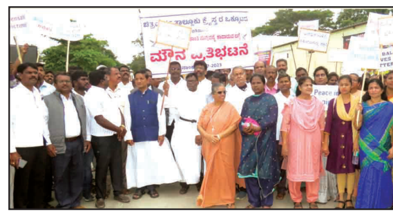
ಮಣಿಪುರದಲ್ಲಿ ಕ್ರೈಸ್ತ ಸಮುದಾಯದ ಮೇಲೆ ನಡೆಯುತ್ತಿರುವ ಹಿಂಸೆಯನ್ನು ಖಂಡಿಸಿ ಜಿಲ್ಲಾಧಿಕಾರಿ ಕಚೇರಿ ಎದುರು ಕ್ರೈಸ್ತ ಸಮುದಾಯದಿಂದ ಪ್ರತಿಭಟನೆ.

ಚಿತ್ರದುರ್ಗ : ಮಣಿಪುರದ ಗುಡ್ಡಗಾಡು ಪ್ರದೇಶಗಳಲ್ಲಿ ಕ್ರೈಸ್ತ ಸಮುದಾಯದ ಮೇಲೆ ನಡೆಯುತ್ತಿರುವ ಹಿಂಸೆಯನ್ನು ಖಂಡಿಸಿ ತಾಲ್ಲೂಕು ಕ್ರೈಸ್ತ ಸಮುದಾಯದ ಒಕ್ಕೂಟದ ವತಿಯಿಂದ ಜಿಲ್ಲಾಧಿಕಾರಿ ಕಚೇರಿ ಎದುರು ಸೋಮವಾರ ಪ್ರತಿಭಟನೆ ನಡೆಸಿ ಜಿಲ್ಲಾಧಿಕಾರಿಗಳ ಮೂಲಕ ಕೇಂದ್ರ ಗೃಹಮಂತ್ರಿಗೆ ಮನವಿ ಸಲ್ಲಿಸಲಾಯಿತು.