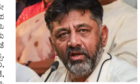
ಬಿಬಿಎಂಪಿ ಮತ್ತು ಸರ್ಕಾರದ ಅನುದಾನದಲ್ಲಿ ಕೈಗೊಂಡ ಕಾಮಗಾರಿಗಳ ಬಿಲ್‌ಗಳನ್ನು ಪಾಲಿಕೆ ಮುಖ್ಯ ಆಯುಕ್ತರೊಂದಿಗೆ ಚರ್ಚಿಸಿ ಬಿಡುಗಡೆಗೆ ಕ್ರಮ ವಹಿಸುವುದಾಗಿ ಉಪ ಮುಖ್ಯಮಂತ್ರಿ ಹಾಗೂ ಬೆಂಗಳೂರು ನಗರಾಭಿವೃದ್ಧಿ ಸಚಿವ ಡಿ.ಕೆ.ಶಿವಕುಮಾರ್ ಭರವಸೆ ನೀಡಿದ್ದಾರೆ. ಬಿಬಿಎಂಪಿ ಗುತ್ತಿಗೆದಾರರ ಸಂಘದ ಪದಾಧಿಕಾರಿಗಳು ಬುಧವಾರ ಡಿ.ಕೆ.ಶಿವಕುಮಾರ್ ಅವರನ್ನು ಭೇಟಿ ಮಾಡಿ, ನಗರದಲ್ಲಿ ನಡೆಸಲಾಗಿರುವ ಕಾಮಗಾರಿಗಳ ಬಿಲ್ ತಡೆಹಿಡಿಯಲಾಗಿದ್ದು, ತ್ವರಿತವಾಗಿ ಬಾಕಿ ಬಿಲ್ ಬಿಡುಗಡೆ ಮಾಡಿಸಬೇಕು. ಬಿಬಿಎಂಪಿ

» ಬೆಂಗಳೂರು ಇಲಾಖೆಯ ವ್ಯಾಪ್ತಿಯಲ್ಲಿನ ತಮ್ಮ ಗಮನಕ್ಕೆ ತರದೇ ಅಧಿಕಾರಿಗಳ ವರ್ಗಾವಣೆ ಮಾಡಿದಂತೆ ಉಪ ಮುಖ್ಯಮಂತ್ರಿ ಡಿ.ಕೆ.ಶಿವಕುಮಾರ್ ಬಿಬಿಎಂಪಿ ಮುಖ್ಯ ಆಯುಕ್ತರಿಗೆ ಸೂಚಿಸಿದ್ದಾರೆ. ಬೆಂಗಳೂರು ನಗರಾಭಿವೃದ್ಧಿ ಇಲಾಖೆಗೆ ಸಂಬಂಧಿಸಿದಂತೆ ಕೆಲವು ವರ್ಗಾವಣೆ ಟಿಪ್ಪಣಿಗಳು ಬರುತ್ತಿದ್ದು ಇಲಾಖೆಗಳಿಗೆ ಸಂಬಂಧಪಟ್ಟವರಾದ ಅಧಿಕಾರಿ, ಸಿಬ್ಬಂದಿ ತಮ್ಮ ಗಮನಕ್ಕೆ ತರದೇ ವರ್ಗಾವಣೆ, ನಿಯೋಜನೆ, ಸ್ಥಳ ನಿಯೋಜಿಸಿ ಯಾವುದೇ ಆದೇಶ ಹೊರಡಿಸಬಾರದು. ಜಿಲ್ಲೆಗೆ, ಆದೇಶ ಹೊರಡಿಸುವ ಪೂರ್ವದಲ್ಲಿ ನನ್ನ ಗಮನಕ್ಕೆ ತರಬೇಕೆಂದು ಉಪ ಮುಖ್ಯಮಂತ್ರಿ ಡಿ.ಕೆ.ಶಿವಕುಮಾರ್ ಅವರು ಬಿಬಿಎಂಪಿ ಮುಖ್ಯ ಆಯುಕ್ತರಿಗೆ ನಿರ್ದೇಶಿಸಿದ್ದಾರೆ. » ಒಟ್ಟು 9 ಅಧಿಕಾರಿಗಳ ವರ್ಗಾವಣೆ: ಒಟ್ಟು ಐದು ಮಂದಿ ಹಿರಿಯ ಆರೋಗ್ಯ ಪರಿವೇಕ್ಷಕರು ಹಾಗೂ ಮೂವರು ಕಂದಾಯ ಪರಿವೇಕ್ಷಕರನ್ನು ಆರ್.ಆರ್ ನಗರ ವಲಯ ಸೇರಿದಂತೆ ವಿವಿಧ ಸ್ಥಳಗಳಿಗೆ ವರ್ಗಾವಣೆಗೆ ಡಿ.ಕೆ.ಶಿವಕುಮಾರ್ ಅನುಮೋದನೆ ನೀಡಿದ್ದಾರೆ. ಗುತ್ತಿಗೆದಾರರಿಗೆ ಖಾಸಿ ಜಿಲ್ಲೆ ಹಾಕಿರುವ ಖರೀದಿ.