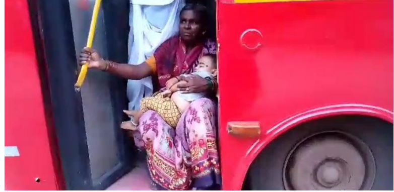
ಬಸ್ ತುಂಬಿದ್ದು ಹಿನ್ನೆಲೆ ಡೋರ್ ಕಂಡಕ್ಕರ್, ಡೈವರ್ ಮೌನವಾಗಿದ್ದರು. ಕನಿಷ್ಠ ಮೆಟ್ಟಿಲು ಬಳಿ ಕುಳಿತಿದ್ದಳು. ಚೆಲಿಸುವ ಬಸ್ ಡೋರ್ ಹಾಕಿಕೊಳ್ಳಬೇಕು, ಅಪಾಯ ಬಿಟ್ಟುಕೊಡಬಹುದಾಗಿತ್ತು. ಈ ಸಂದರ್ಭದಲ್ಲಿ ತಂದೊಡ್ಡುವ ಇಂಥ ಪ್ರಕರಣಗಳ ಬಗ್ಗೆ ಕಾಳಜಿ ವಹಿಸಬೇಕಾದ ಹುಲಿಯಿಂದ ಕಂಡು ಬಂತು.

» ಕೊಡಗ ರಾಜ್ಯದಲ್ಲಿ ಶಕ್ತಿ ಯೋಜನೆ ಜಾರಿಯಾದ ಹಿನ್ನೆಲೆ ಹಲವು ರೀತಿ ಅವಘಡಗಳು ಸಂಭವಿಸುತ್ತಿವೆ. ಈ ಮಧ್ಯೆ ಕೊಪ್ಪಳದಲ್ಲಿ ಸಹ ಪ್ರಯಾಣಿಕರಿಗೆ ಕನಿಷ್ಠ ಮಾನವೀಯತೆ ಇಲ್ಲದಂತೆ ವರ್ತಿಸಿದ ಘಟನೆ ಬೆಳಕಿಗೆ ಬಂದಿದೆ. ಕೊಪ್ಪಳದಿಂದ ಹುಲಿಗಿ ಬಸ್ ನ ಬಾಗಿಲಿನ ಮೆಟ್ಟಿಲು ಮೇಲೆ ಮೊಮ್ಮಗುವನ್ನು ಹಿಡಿದು ಅಜ್ಜಿ ಕುಳಿತಿದ್ದಳು. ಈ ಬಸ್ ನಲ್ಲಿ ಪ್ರಯಾಣಿಕರಿಂದ ತುಂಬಿತ್ತು. ಇದೇ ಬಸ್ ನಲ್ಲಿ ಪ್ರಯಾಣಿಸುತ್ತಿದ್ದ ಅಜ್ಜಿ ತನ್ನ ಮೊಮ್ಮಗುವಿಗೆ ಜಾಗ ಇರಲಿಲ್ಲ. ಬಸ್ ನಲ್ಲಿ ಮಗುವಿಗೆ ಗಾಳಿಯಾಡದ ಹಿನ್ನೆಲೆ ಬಸ್ ಡೋರ್ ನ ಮೆಟ್ಟಿಲು ಮೇಲೆ ಕುಳಿತಿದ್ದಳು. ಸೀಟ್ ಇಲ್ಲದ ಕಾರಣ ಬಸ್ ಡೋರ್ ಮೆಟ್ಟಿಲು ಮೇಲೆ ಕುಳಿತಿದ್ದು ದೃಶ್ಯ ವೋಲ್ಟೇಜ್ ಕ್ಯಾಮರಾದಲ್ಲಿ ಸೆರೆಯಾಗಿವೆ. ಒಳಗಡೆ ಕುಳಿತುಕೊಳ್ಳಲು ಹೇಳಿದರು.